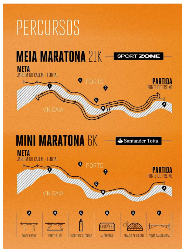
Figura 1: Itinerário da Maratona do Porto em 2015. (Fonte: RunPorto (2015)).

A Meia Maratona do Porto Sport Zone , tal como refere a RunPorto, que organiza esta prova, na sua página web , desfruta de uma paisagem incrível, sempre junto ao Rio Douro atravessando a emblemática Ponte D. Luís I, unificando as 2 cidades vizinhas, Porto e Vila Nova de Gaia (RunPorto, 2015), como se pode observar na Figura 1. A RunPorto disponibiliza informação na sua página Web , onde se pode obter toda a informação acerca do evento, desde o percurso, pontos de abastecimento, preços associados, informações de outras edições, tempos recordes entre outra informação. Na opinião dos organizadores da prova e diretores da RunPorto, a meia maratona é uma das mais emblemáticas de Portugal. Em simultâneo com a prova da meia maratona realiza-se também a prova denominada de mini maratona com uma distância de 6 Km.