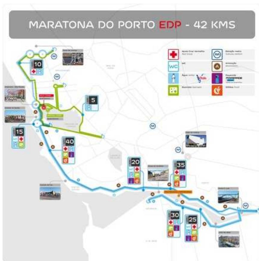
Figura 2: Itinerário da Maratona do Porto em 2015.

A primeira edição da Maratona do Porto no ano de 2004 contou com 317 participantes, a segunda reuniu 315. Em 2015, o número de participantes inscritos, aproximam-se de 15000, repartidos pelas 3 modalidades disponíveis: 42 km, 16 km e 6 km. Na prova Maratona, os 42 Km, contou com aproximadamente 5.000 inscritos. O percurso da prova principal e das duas provas associadas pode observar na Figura 2.