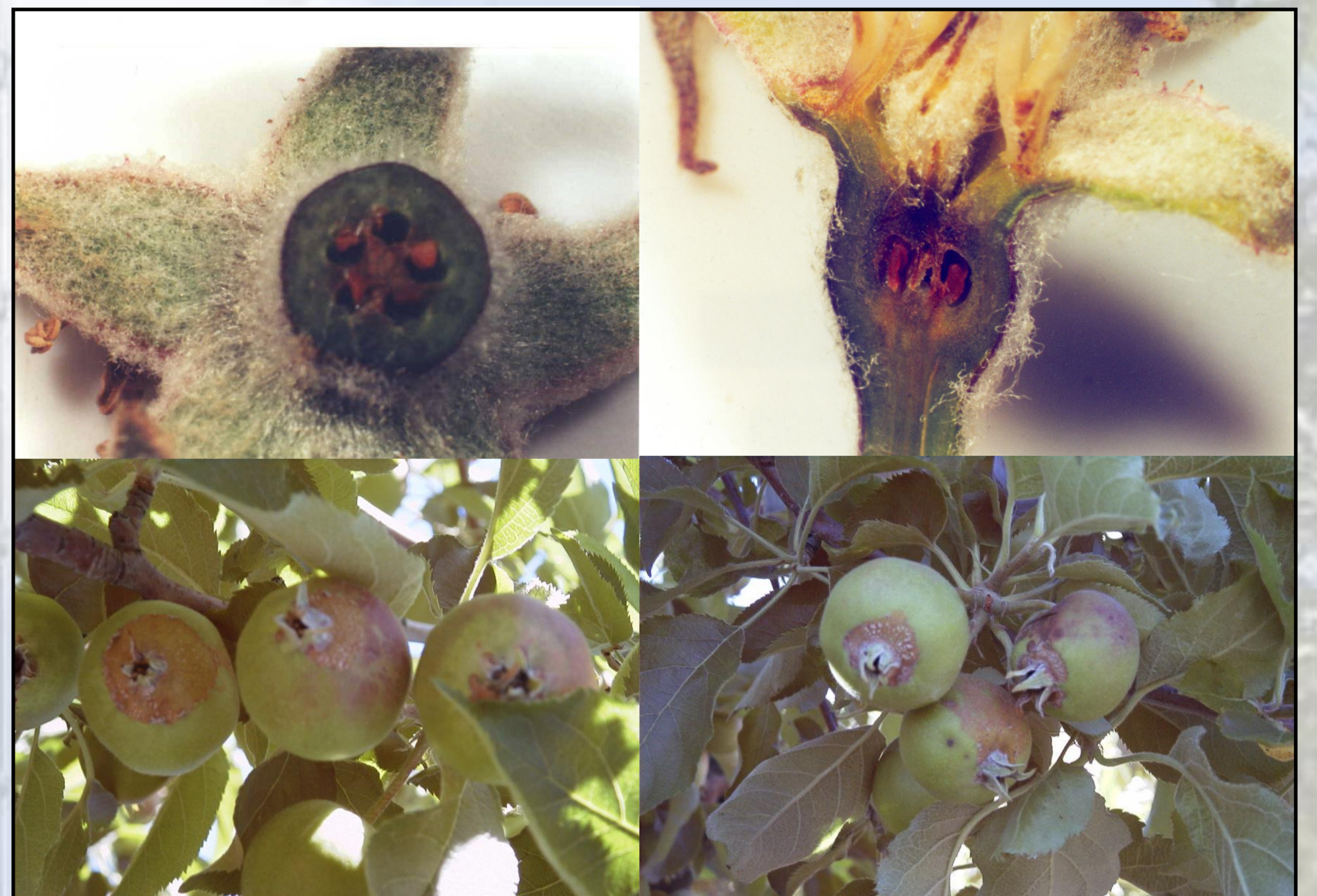
Figura 2. Cortes longitudinal e transversal de uma flor e deformações nos frutos provocados pelas geadas.