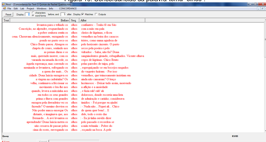
Figura 10: Concordâncias da palavra-tema “olhos”.

9.º- A palavra-tema olhos , que, como vimos anteriormente, é a forma lexical que apresenta a frequência de ocorrência mais elevada, ocorrendo 83 vezes no texto, remete-nos através do corpo das personagens para o seu mundo interior, que é de enorme sofrimento. Deste modo, tal como se pode concluir pela leitura das concordâncias da forma linguística olhos (figura 10), as palavras que ocorrem com a palavra-tema olhos veiculam esse sentimento de sofrimento, que constitui a temática da obra em estudo.