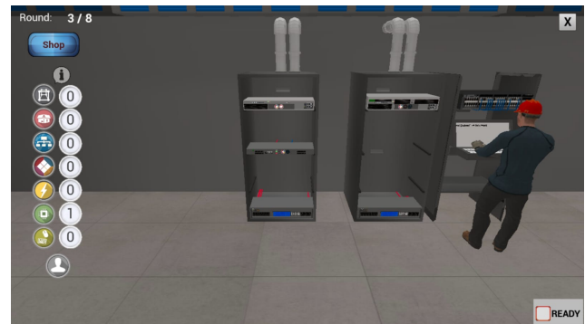
Figura 1. Data-center de um jogador.

Durante a aplicação do jogo Cabinet, um dos fatores mais analisados foi a interação entre os alunos. Por se tratar de um jogo que coloca ambos os alunos em um cenário competitivo, onde cada um tem que buscar construir o melhor data-center (Figura 1) com uma pré determinada quantidade de turnos e os recursos que são coletados (Figura 2) ao longo dos mesmos, o jogo foi capaz de causar euforia e