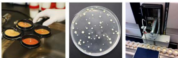
Figura 1- a) Execução do TCM; b) Cultura bacteriana; em PCA; c) Contador de células FOSSOMATIC ® 6000.

Todas as amostras de leite recolhidas foram submetidas à CCS. Estas foram preservadas pela adição de broponol (2-bromo-2-nitro-1,3-propanodiol), congeladas a -70°C e enviadas para o laboratório CENSYRA - Centro de Selección y Reproducción Animal de León, Espanha. Neste, foram processadas por citometria de fluxo, num contador automático de células FOSSOMATIC ® Milkscan 6000 a uma temperatura de 40°C (Figura 1c).