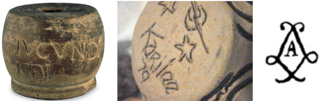
Figura 2. Marca de cerâmica, titulus pictus , na Roma antiga (Moore Reid, 2008)

O uso de uma marca, como forma de diferenciação parece ter tido origem na civilização egípcia, com os fabricantes de tijolos que colocavam símbolos para identificar aos seus produtos. Alguns dos primeiros bens manufaturados em produção em massa foram painéis de barro, cujos restos podem ser encontrados em grande abundância ao redor da região do Mediterrâneo, particularmente nas antigas civilizações da Etrúria, Grécia e Roma (Khan e Mufti, 2007). De acordo com Srivastava et al. (1998) há evidência de uso de marcas de oleiro entre restos encontrados em escavações, nas quais o oleiro identificava as suas painéis no fundo, colocando a sua impressão digital na argila húmida ou fazendo a sua marca: um peixe, uma estrela ou cruz, por exemplo. A partir daí, pode-se dizer com segurança que os símbolos (em vez de iniciais ou nomes) foram a forma visual mais antiga das marcas.