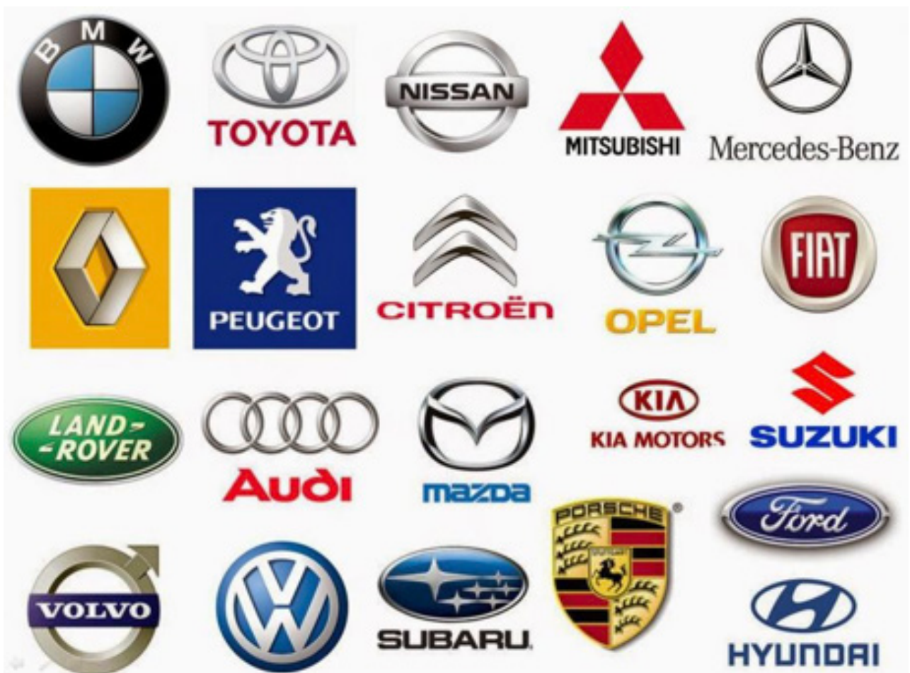
Figura 5. Marcas de automóvel no final do séc. XIX, XX

das marcas de produtos de consumo mais conhecidas datam de esse período como são exemplos os refrigerantes Schweppes. , as sopas Campbell , as máquinas de costura Singer ou os sabões Pears .