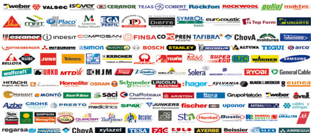
Figura 6. Marcas comerciais mundialmente reconhecidas

marketing começaram ajuda a explicar por que os produtos de marca são tão omnipresentes hoje em dia (Arons 2011).