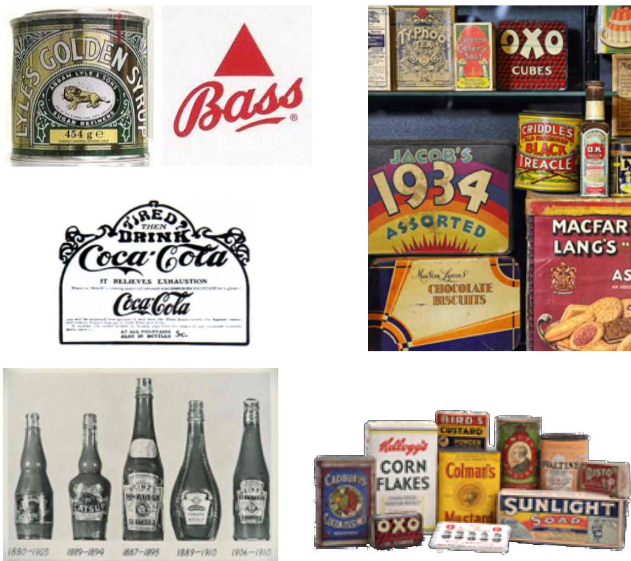
Figura 3. Revolução Industrial

de uma produção artesanal para a produção industrial. Por exemplo a marca de cerveja Bass & Company, é um bom exemplo desta transição (Schwarzkopf, 2008). No sector automóvel o aparecimento dos primeiros automóveis fabricados em série deu origem a marcas ainda hoje reconhecidas internacionalmente, como a Peugeot (1894), Renault (1899), Vauxhall (1857), Fiat (1899), Ford (1903, ainda que o primeiro automóvel fabricado por Henry Ford tenha sido em 1886), Rolls-Royce (1906) (Porázik e Oravec, 1985). Ainda que a designação de vinho do Porto tenha surgido na segunda metade do séc. XVII (Barreto, 1993) parece ter sido a Bass & Company , a marca de cerveja britânica fundada em 1777, a pioneira no marketing de marcas internacionais (Lury, 2004). A marca de vinho do porto terá surgido, de acordo com Barreto (1993) em 1756, sendo a partir dessa altura demarcada a região produtora deste vinho. Todavia no princípio do séc. XVIII, com o comércio com os ingleses, terá começado a “nascer sub-repticiamente a marca de o vinho do Porto moderno”.