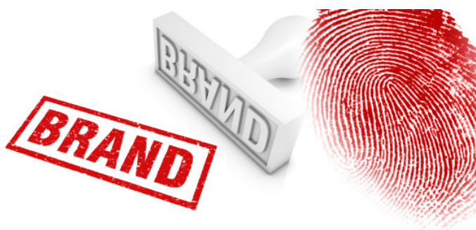
Figura 1. Marca o que é?

Uma marca é, em sentido geral, uma identificação comercial que corresponde a um conjunto de identificadores com os quais se relaciona e associa o produto ou o serviço oferecido a um determinado mercado. Um “nome de marca” constitui uma associação com o tipo de produto, de fábrica, processo produtivo ou propriedade. Neste último caso, o proprietário ou proprietários podem tentar proteger os direitos de propriedade através de um registo. Neste sentido, uma marca pode ter associado uma série de identificadores, como: nome, sigla, logo, neologismos, localização geográfica, etc. A identidade da marca é aquela que o seu proprietário