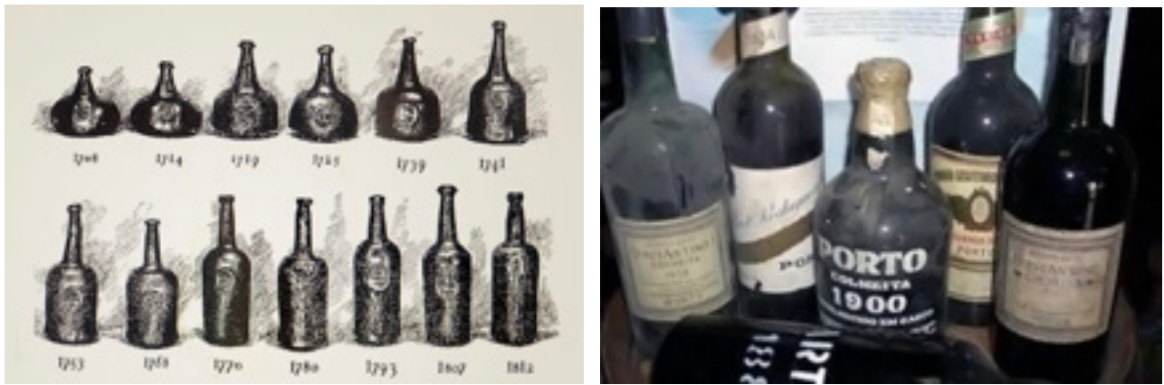
Figura 4. A marca Vinho do Porto