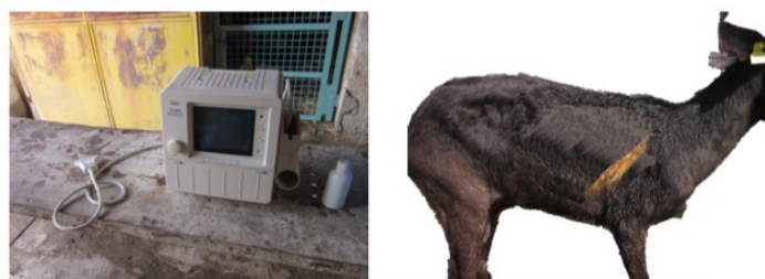
Figura 1 – Área de exploração ecográfica do tórax nos caprinos e equipamento utilizado.

Neste trabalho, os autores utilizam, pela primeira vez, a ecografia no diagnóstico ante morte de tuberculose num caprino, associada aos métodos convencionais de diagnóstico pós morte. Os resultados demonstram a utilidade do exame ecográfico como primeiro método de diagnóstico de lesões pulmonares granulomatosas, compatíveis com tuberculose. Por outro lado, sendo um método rápido, poderá conduzir a medidas sanitárias precoces, o que poderá ser decisivo na luta contra a tuberculose caprina.