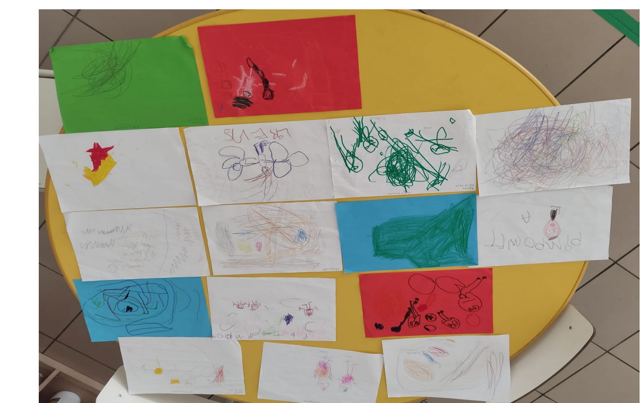
Fig.4 – Reprodução final das atividades desenvolvidas durante o Projeto