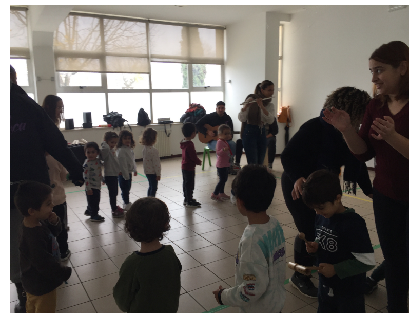
Imagem 2 – Atividade musical de grupo

Podemos referir que o público-alvo, apresentou índices de participação bastante elevados; aprenderam as letras e melodias das diversas canções aplicadas; reproduziram o que aprenderam em texto ilustrado (conforme figuras apresentadas); memorizaram as melodias aprendidas; manifestaram estados de satisfação que se consideram positivos.