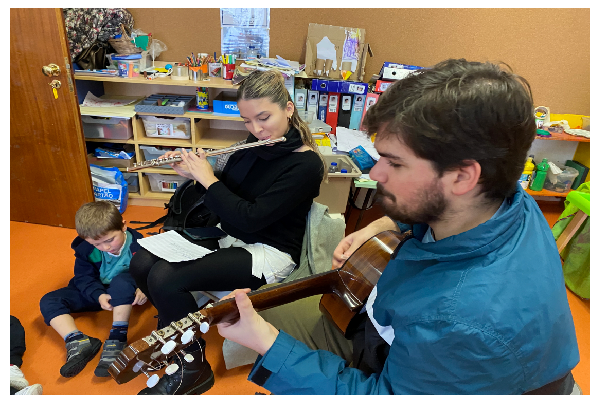
Imagem 1 – estudantes do curso de MCC na execução do projeto musical

Nas diferentes intervenções realizadas, as crianças aprenderam e conheceram diversas canções e manusearam instrumentos musicais. Foi ainda possível observar que as dinâmicas de grupo se alteravam à medida que as intervenções iam ocorrendo, nomeadamente, no que concerne ao aumento do tempo de concentração nas atividades e na maior satisfação e envolvimento emocional, face à presença dos estudantes e desenvolvimento do projeto.