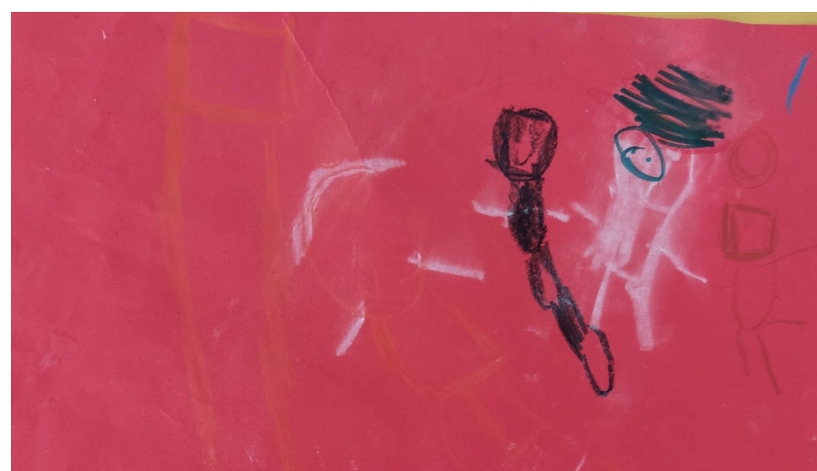
Fig.2 – Reprodução livre da canção “A chuva cai, cai, cai”