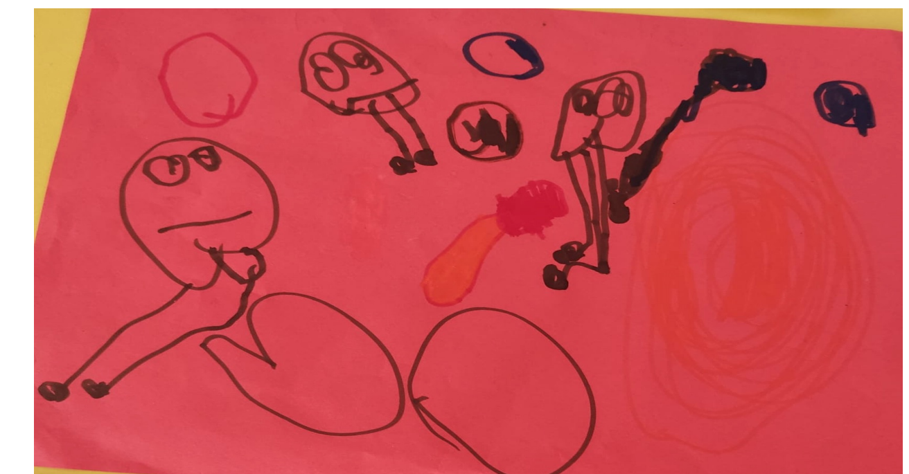
Fig.3 – Reprodução de instrumentos musicais

Como conclusão, entende-se que este género de projetos pode potenciar o envolvimento com a comunidade, relativamente ao conhecimento de diferentes vertentes artísticas, em particular da música que se pratica nas Tunas académicas, bem como apresentar um papel importante na criação de espaços de afetos.