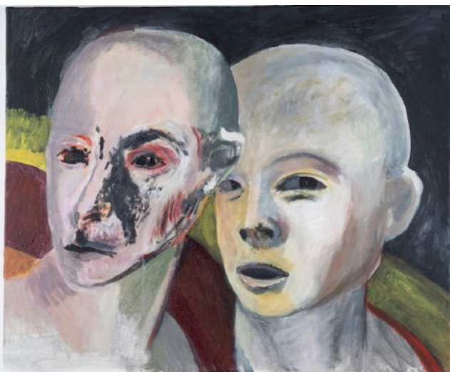
Fig. 3 Graça Morais, A Ameça , 2021. Acrílico sobre tela, 60 x 73 cm. Col. da Artista. © Cortesia da Artista.

De facto, nos retratos de Graça Morais, seja qual for a sua fase de produção, a síntese formal e a expressão pictórica tendem a converter cada face numa “máscara que tem a presença de um rosto vivo e as figuras olham-nos com a fixidez de máscaras” (Fernandes 1990, s.p.). Neste sentido, os rostos que surgem nas suas composições têm sempre uma qualidade de retrato – mesmo quando transmutados em máscara ou até quando se metamorfoseiam ou se desmaterializam em estranhas e já quase irreconhecíveis figurações fantasmáticas, como aquelas que surgem em alguns dos seus trabalhos mais recentes (fig. 3).