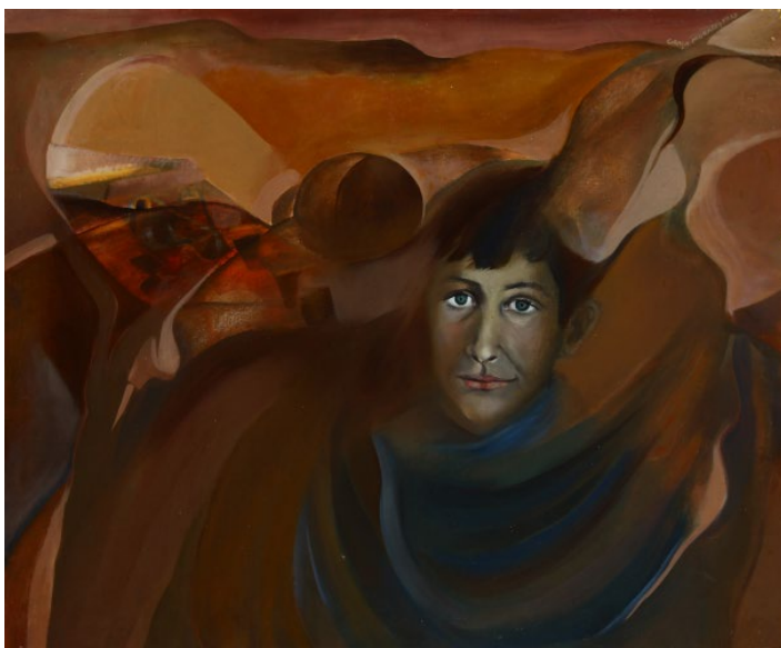
Fig. 1 Graça Morais, Sereno , 1973. Óleo sobre tela, 74 x 90 cm. Col. da Artista.