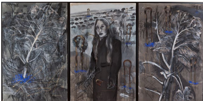
Fig. 4 Graça Morais, Auto-retrato (?) , 2001. Acrílico, carvão e pastel sobre tela. Triptico, cada painel: 195 x 130 cm. Col. da Artista. © Cortesia da Artista.

um auto(re)conhecimento e sentido de pertença no mundo, seja ele delimitado pelo seu território matricial, seja ele extensível a um universo global onde encontra sempre novos motivos para a sua pintura.