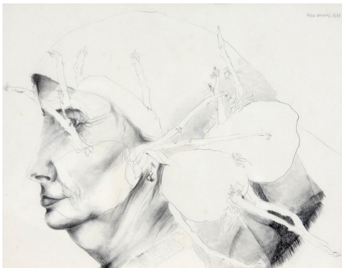
Fig. 2 Graça Morais, Vieiro , 1981. Grafite sobre papel, 31 x 41 cm. Col. particular. © Cortesia da Artista.

É no regresso a Portugal, e em particular quando se estabelece no Vieiro (sua aldeia natal), num retiro que viria a prolongar-se por cerca de dois anos (1980-1982), que Graça Morais assume em pleno a consciência da sua identidade e define o caminho que a sua pintura irá seguir. Neste processo, em que escolheu deliberadamente a sua terra para “tentar levar a cabo, ao mesmo tempo, uma investigação e uma criação sobre a permanência dos costumes e da vida rural” (Morais 1983 apud Costa 2014, 47), o retrato constitui o principal veículo de abordagem a um dos grandes temas da sua prática artística: a figura e a condição feminina, questionada a partir do contacto com as histórias e as vivências das mulheres da sua terra – essas mulheres que a pintora designará mais tarde como “As Escolhidas” (título de uma série de 1994), ou simplesmente “Marias” (série de 1996).