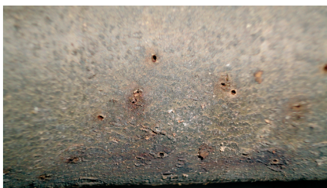
Ataque de escolitídeos em árvores de castanheiro (Melhe - Vinhais)