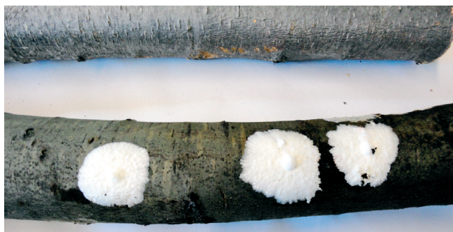
Ramos de castanheiro em laboratório depois da saída dos escolitídeos (Desenvolvimento de fungos que decompõem a madeira de castanheiro)