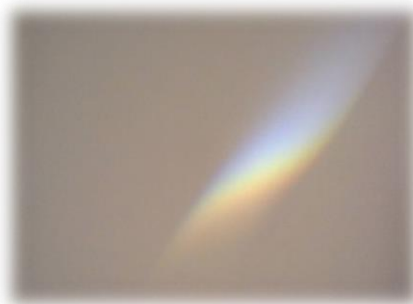
Figura 17 - Resultado da atividade prática sobre a formação do arco-íris.

Estes procedimentos foram repetidos com as crianças, na atividade que vínhamos a descrever, foi possível observarmos a refração da luz, formando o arco-íris que se apresenta na figura 17.