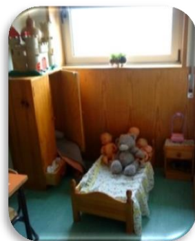
Figura 6- Área da casa, espaço do quarto.

A área da casa distribuía-se por dois espaços, o quarto (figura 6) e a cozinha (figura 7). O mobiliário e materiais desta área estavam apropriados à altura das crianças. Nesta, era visível a frequente representação, por parte das crianças, assumindo o papel de adultos, imitando expressões gestuais e orais. Através das bonecas as crianças representavam vivências do seu dia-a-dia, como vestir e despir as crianças, deitá-las a dormir, maquilhá-las faziam e desfaziam a cama, arrumavam e desarrumavam toda a área, representando de variadas formas o “faz-de-conta”.