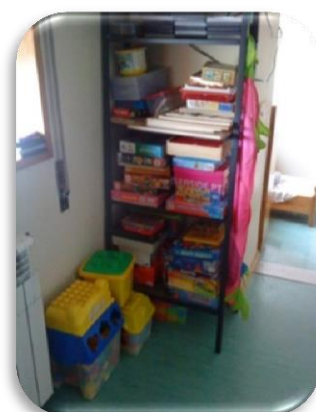
Figura 5 - Área dos jogos.

A área dos jogos (figura 5) estava localizada perto da área do acolhimento, dispunha de uma mesa acompanhada por cinco cadeiras e de uma estante, na qual se encontravam diversos tipos de jogos: puzzles, enfiamentos, dominós, blocos lógicos, jogo de letras, jogos com formas geométricas, entre outros. Esta área permitia o desenvolvimento cognitivo das crianças, além das experiências diversificadas que as motivavam para a resolução de problemas.