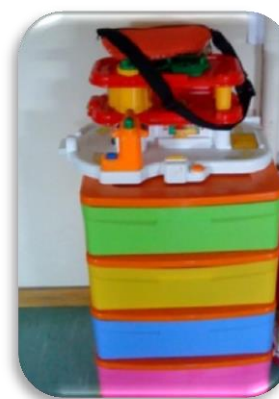
Figura 8 - Área da garagem/construções.

A última área a ser apresentada é intitulada pela área da garagem/construções (figura 8). Nesta as crianças usavam materiais como carros, ferramentas de mecânica, uma pista de carros, entre outros. As crianças, principalmente do sexo masculino, apropriavam-se ou tentavam por várias vezes apropriar-se desta área, pois mostravam bastante interesse na mesma, gostavam de brincar e imaginar situações próprias da área.