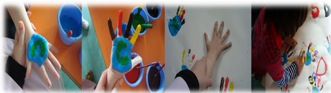
Figura 19 - Sequência de imagens da construção do cartaz.

Importa, neste âmbito relevar que nas OCEPE (ME/DEB, 1997), se alerta para a importância de as crianças terem “à sua disposição várias cores que lhes possibilitem escolher e utilizar diferentes formas de combinação” (p. 62). Sublinhamos, ainda, a