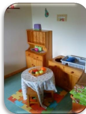
Figura 7 - Espaço da cozinha.

O espaço da cozinha era utilizado para representar vivências do dia-a-dia, integrando parencas com algumas cozinhas das casas das crianças e, em várias situações, as crianças assumiam os papéis de adultos e representavam momentos vividos nas suas próprias casas.