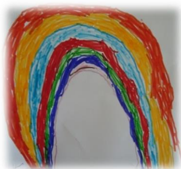
Figura 15 - Arco-íris elaborado por uma criança da sala.

Durante a atividade, as crianças comentavam, entre si, qual seria a cor com que o arco-íris iniciava, tentavam lembrar-se da ordem das cores, e curiosamente comentavam o formato do arco-íris, referiam-se a este como tendo uma forma muito semelhante a uma ponte. Depois de várias crianças terem desenhado o arco-íris, exemplo figura 15, mostrámos a imagem do mesmo, no sentido de melhor perceberem como era constituído. Esta experiência permitiu relembrar as cores, partindo da sua identificação num fenómeno da natureza.