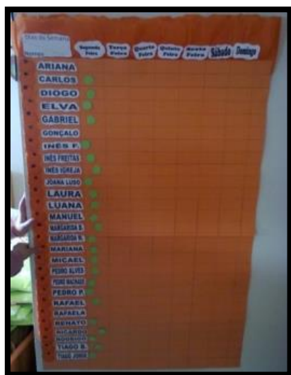
Figura 9 - Quadro semanal de presenças.

Para registrar as presenças diárias das crianças foi criado um quadro semanal de presenças, como pudemos verificar na figura 9, este estava adequado à altura das crianças. Foi criado, “para o aluno marcar com um sinal convencional a sua presença, na quadrícula onde o seu nome cruza com a coluna do dia” (Niza, 2007) (p. 135).