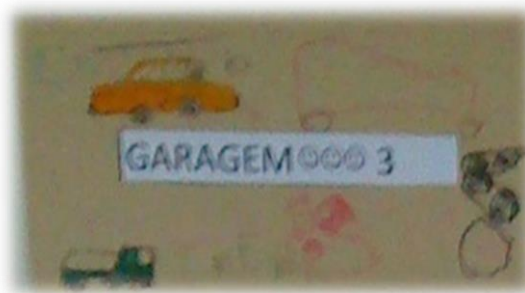
Figura 1 - Identificação das áreas da sala.

A sala, na qual desenvolvemos a prática de ação pedagógica, apresentava uma forma retangular e, como anteriormente foi referido, a sala não possuía grandes dimensões. Desde o início, percebemos que toda ela estava, previamente, dividida por áreas, e todas elas estavam identificadas com uma placa com o nome e o