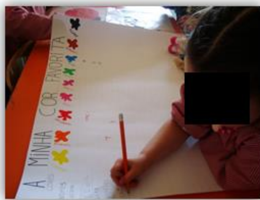
Figura 21 - Criança preenchendo a tabela das cores favoritas.

Propusemos ao grupo o registo desses dados, elaborando para o efeito uma tabela de dupla entrada. Propusemos às crianças que sugerissem um título para a tabela, ideia para a qual apontam Castro e Rodrigues ( idem ). Após várias respostas das crianças, acordámos que o título fosse A minha cor favorita . O nome das crianças foi registado, por elas, na quadrícula vertical do lado esquerdo e na horizontal indicámos as cores, como mostra a figura 21.