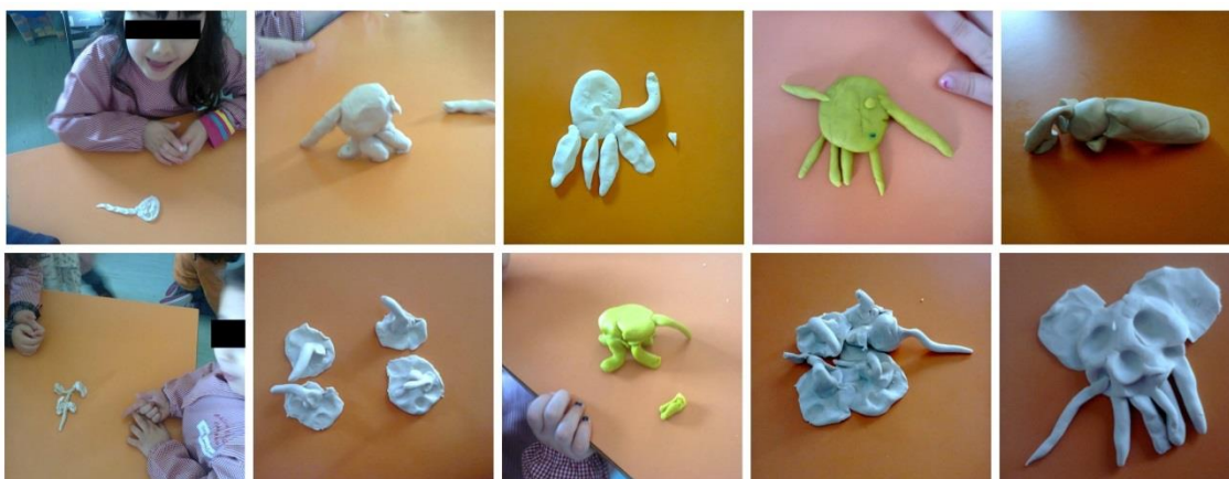
Figura 10 – Produções das crianças, em plastilina, na sequência da exploração da história do Elmer.

As figuras apresentadas permitem observar diferentes produções, no que se refere à reprodução de algumas partes do corpo quer à cor escolhida para elaborar o trabalho. As várias formas de representação também nos permitem perceber diferentes níveis de representação simbólica, incluindo e diferenciando várias partes do corpo do animal, algumas ainda o seu modo de locomoção, enquanto outras representam apenas, para além do corpo no seu todo, a parte que mais o diferencia dos outros animais, a tromba. Como refere Gonçalves (1991) “a expressão é motivada pelo que mais a impressiona” (p. 13).