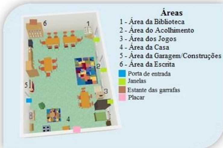
Figura 2 - Planta da sala

A sala integrou, desde início, seis áreas de trabalho, todas devidamente identificadas, sendo estas: a área da casa (cozinha e quarto), a área dos jogos, a área de acolhimento, a área da biblioteca, a área da escrita e a área da garagem/construções. Estas estavam organizadas no sentido de possibilitar ao grupo de crianças um fácil acesso aos distintos materiais e objetos, pois, como menciona Oliveira-Formosinho (2007b) “a organização do espaço em áreas com os seus respectivos materiais (...), porque estão visíveis, acessíveis e etiquetados (também para facilitar a autonomia na arrumação), é uma forma poderosíssima de passar mensagens implícitas à criança” (p. 68).