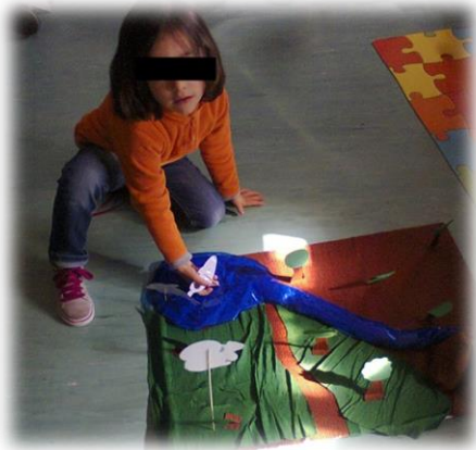
Figura 11 - Criança colocando o animal no habitat.

Informámos as crianças que todas as repostas correspondiam a elementos que faziam parte dos habitats dos animais e que estes eram de três tipos, o terrestre, o aquático e o aéreo. Realizámos uma breve explicação às crianças da constituição dos habitats e dos animais que os habitavam.