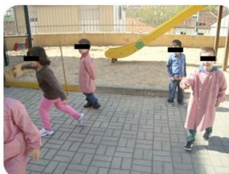
Figura 20 - Crianças procurando objetos da respetiva cor.

De regresso à sala de atividades, e em grande grupo, realizámos a contagem dos objetos observados e registados pelos adultos, com base na indicação dada pelas crianças de cada um dos grupos. O grupo que observou mais elementos foi o que tinha como tarefa observar elementos de cor amarela, tendo registado um total de treze, seguindo-se-lhe o