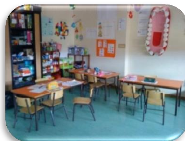
Figura 4 - Área da escrita.

Do outro lado da sala, estava situada a área da escrita (figura 4), nesta as crianças tinham a oportunidade de escrever, explorar as diferentes formas das letras, podendo inclusivamente manipular materiais de escrita.