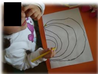
Figura 14 - Desenho de um arco-íris realizado por uma criança da sala.

Sugerimos às crianças que desenhassem e pintassem numa folha branca, como julgavam que era constituído o arco-íris, exemplo figura 14.