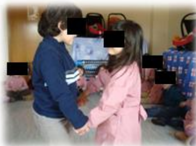
Figura 16 - Crianças jogando o Jogo dos sorrisos.

O jogo constava de uma criança, de cada vez, ir retirar um cartão de dentro de uma caixa, no qual estava escrito uma mensagem, que educadora lhe lia e que ela iria transmitir a alguém da sala, que escolhesse dirigir-lha. Todas as crianças participaram no jogo, recebendo e manifestando gestos. Entre as mensagens escritas nos cartões encontrava-se, por exemplo, dar um abraço, um beijo no rosto, um aperto de mão, entre outros. As crianças manifestaram grande interesse e entusiasmo em realizar o jogo, observando-se grande envolvimento na realização do mesmo, como a título de exemplo a imagem da figura 16 permite perceber que as crianças estão a dar as mãos, manifestando gesto de carinho.