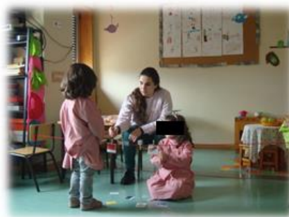
Figura 18 - Interajuda entre as crianças da sala.

-Não acho que é maior que as outras (Rodrigo)