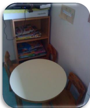
Figura 3 - Área da biblioteca.

Podemos verificar, na figura 2, que as áreas rotuladas como barulhentas encontram-se um pouco afastadas das áreas mais calmas. A área da biblioteca (figura 3)