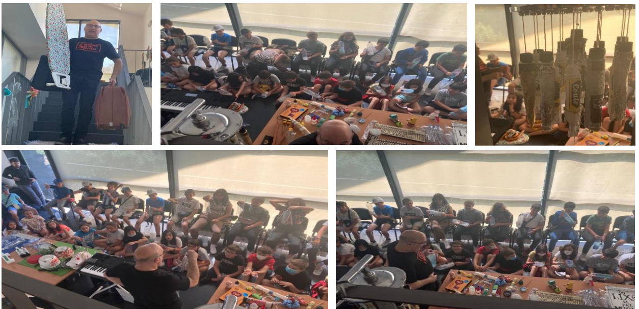
Workshop – Do Lixo se faz Música