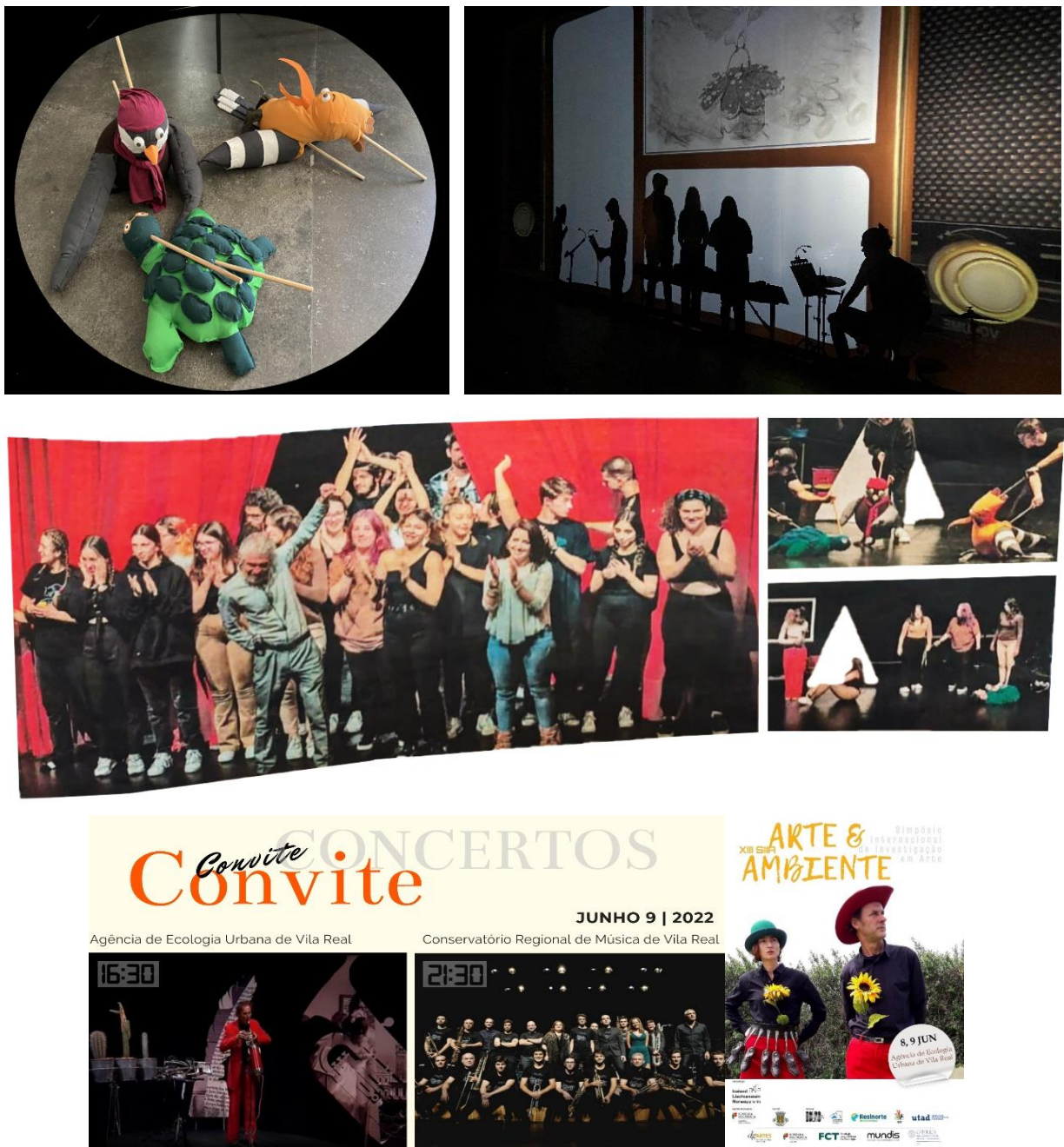
Os Contos da Biodiversidade de Vila Real