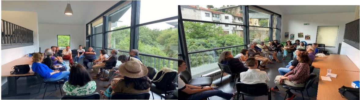
Sessão pública de Trabalho – Projeto Rosa do Mundo