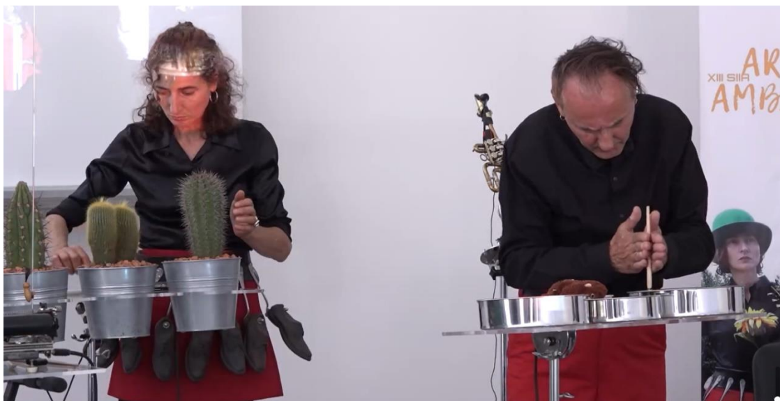
Concerto performance “HÁ-SOM”