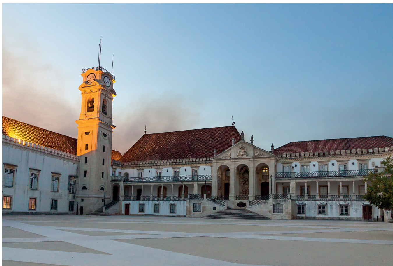
15 de outubro de 2017