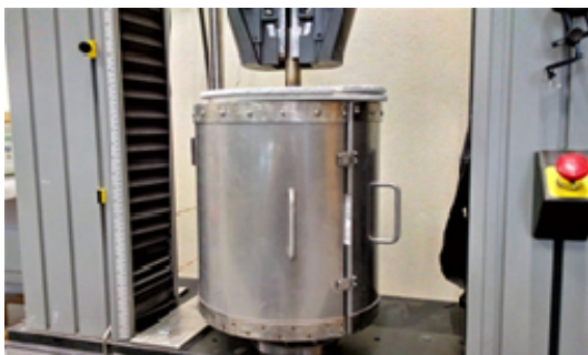
Figura 2: Forno fixado na base do sistema de ensaios mecânicos da série Instron® 4485.