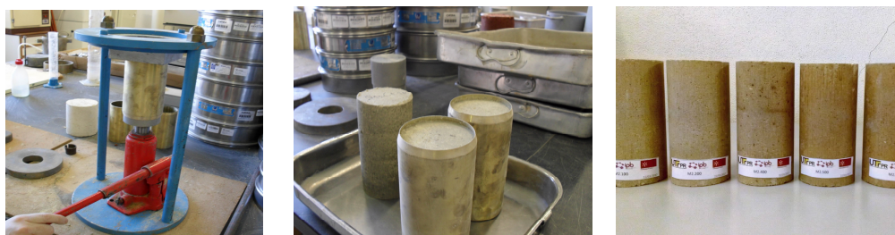
Figura 1: Execução dos provetes cilíndricos.

Para a realização dos ensaios cerca de 100 provetes cilíndricos com as dimensões de 70x140 mm foram concebidos. Os provetes foram produzidos com solo residual granítico (SRG) típico do norte de Portugal, recolhido da localidade de Louredo em Guimarães e as suas propriedades foram analisadas em termos de granulometria [16] limites de consistência [17], baridade seca máxima e teor ótimo em água [18]. O solo apresenta percentagem de finos insuficiente, especialmente no que diz respeito à argila, cuja percentagem é de cerca de 4%. De uma percentagem de argila tão baixa espera-se problemas no processo de fabrico, nomeadamente na obtenção de uma coesão inicial dos BTC para a sua desmoldagem e manuseamento imediatos. O valor obtido para o teor ótimo em água foi de cerca de 12% e para a baridade seca máxima foi de cerca de 1,71 g/cm 3 , o que também indica que os BTC fabricados com o solo natural poderão apresentar resistência mecânica insuficiente. Assim, verifica-se a inadequabilidade do SRG recolhido para o fabrico de BTC no seu estado natural, pelo que estabilização química é necessária. A estabilização do solo foi feita com cal e cimento [19], ver Figura 1.