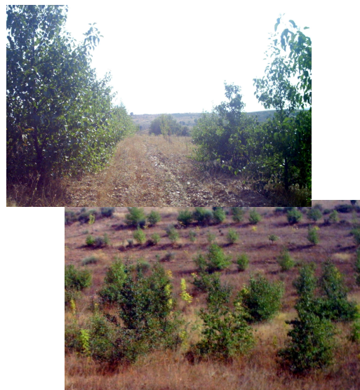
Aspecto geral do ensaio

As amostragens para quantificar o N mineralizado foram realizadas, segundo a metodologia de Raison et al. (1987), durante o período de Abril a Agosto de 2005, utilizando-se para o efeito, tubos de aço de 25 cm de comprimento e 5 cm de diâmetro. Para o estudo consideraram-se as parcelas: puro de freixo (Fe), puro de amieiro (Ac) e freixo e amieiro consociado na linha (Fe e Ac) de forma alternada com um compasso de 3,5x2,0m. Em cada parcela foram considerados 4 pontos de amostragem .