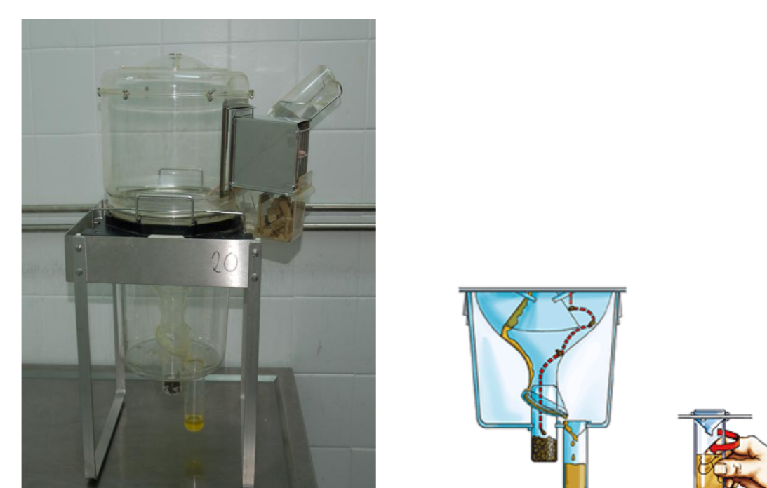
Figura 2: Recolha de urina numa gaiola metabólica