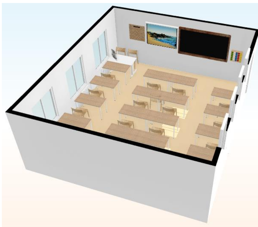
Figura 1: representação da sala de aula vista de noroeste para sudeste

Segue-se uma representação da sala de aula: