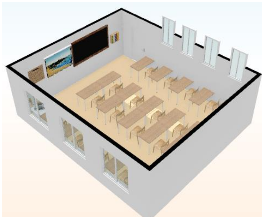
Figura 4: representação da sala de aula vista de sudoeste para nordeste