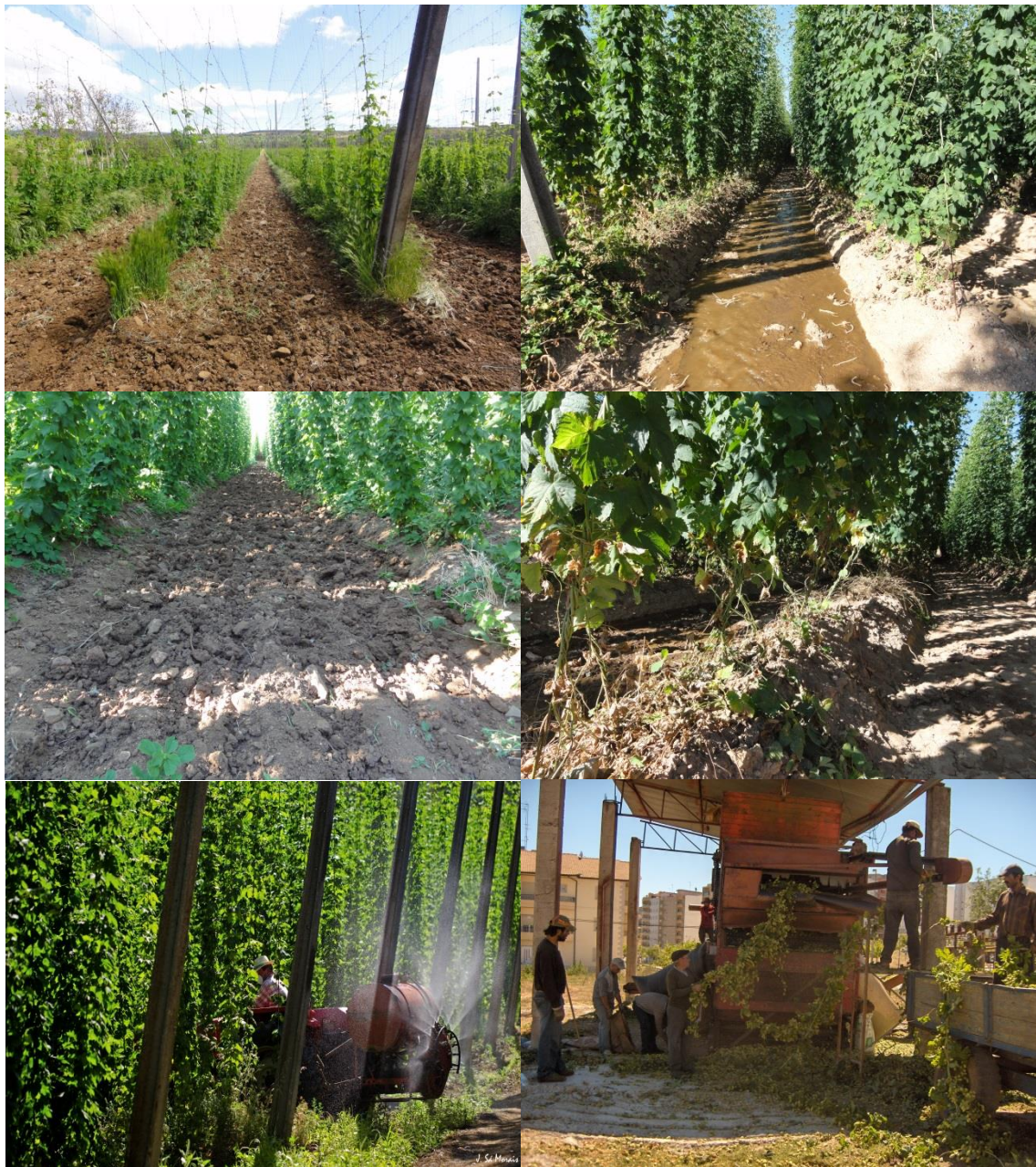
Figura 4. Campo de lúpulo em fase avançada da colocação dos sarmentos a trepar (em cima à esquerda), rega à manta (em cima à direita), mobilização do solo para destruição de crosta superficial provocada pela rega (ao centro à esquerda), desfolha química (ao centro à direita), aplicação de tratamento fitossanitário (em baixo à esquerda) e ripagem das flores (em baixo á direita).

sarmentos a 1 m do solo e destacam-se da parte superior, fazendo-se o transporte em reboque para a máquina colhedora de flores que é estacionária. Na máquina há setores para a entrada das lianas, separação de flores e folhas dos caules, separação das folhas das flores com base na forma e densidade e saída das lianas. A Figura 4 reúne um conjunto de aspetos relevantes da técnica cultural incluindo o processo de separação das flores da planta.