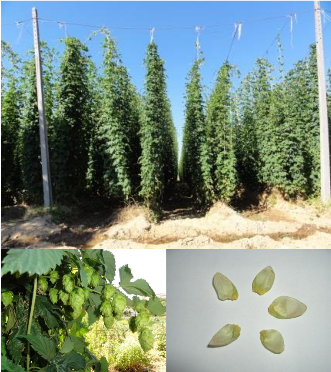
Figura 3. Aspeto de um campo de lúpulo a meio da estação de crescimento (em cima), inflorescências femininas ou cones (em baixo à esquerda) e grânulos de lupulina na base das bractéolas (em baixo à direita).

Os solos devem ser naturalmente férteis. Algumas das principais características favoráveis são espessura efetiva elevada, bom arejamento (dependente da textura, estrutura e teor de matéria orgânica), pH próximo da neutralidade e teor de matéria orgânica elevado (Navarro et al., 1982). Contudo, profundidade e textura são os aspetos mais determinantes uma vez que os restantes podem ser modificados pela técnica cultural.