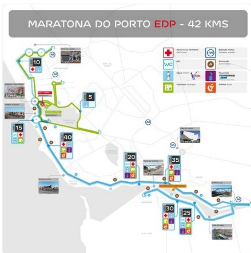
Figura 2: Itinerário da Maratona do Porto em 2015.

A primeira edição da Maratona do Porto no ano de 2004 contou com 317 participantes, a segunda reuniu 315. Em 2015, o número de participantes inscritos, aproximam-se de 15000, repartidos pelas 3 modalidades disponíveis: 42 km, 16 km e 6 km. Na prova Maratona, os 42 Km, contou com aproximadamente 5.000 os inscritos.