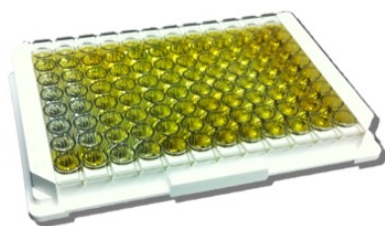
Figura 1- Placa de 96 poços utilizada no ensaio imunoenzimático (Mast ID RANGE, Milk Amyloid A Assay Kit).

A análise estatística dos dados foi realizada com o Microsoft ® Excel 2010 – Microsoft Office ® e JMP ® versão 9.0- Statistical Software.