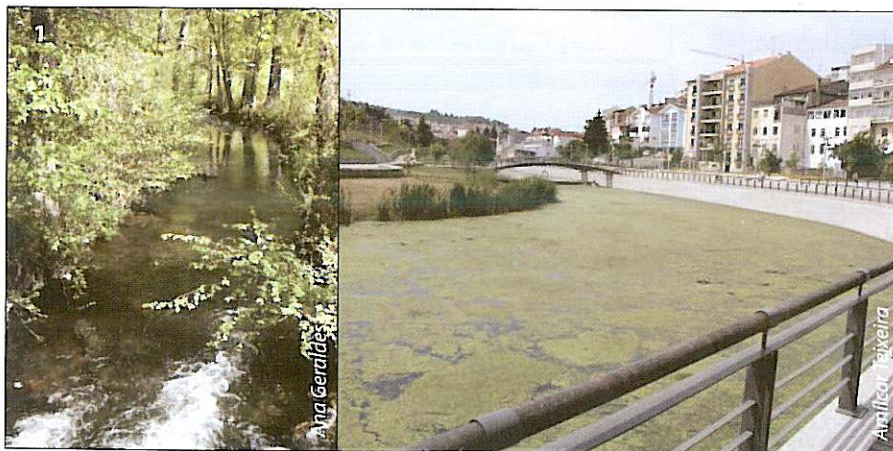
1 – Galeria ripícola natural. 2 – Crescimento de algas: Resultado da eliminação da galeria ripícola e artificialização das margens.

Plantar as espécies autóctones típicas das margens dos cursos de água (amieiros, salgueiros, freixos). Estas espécies estão bem adaptadas ao seu ambiente natural e garantem o equilíbrio ecológico dos ecossistemas. São mais fáceis de obter e, ao contrário das plantas exóticas, não têm o perigo de se tornarem infestantes. Por vezes as margens já estão muito degradadas e artificializadas sendo necessário recorrer a técnicas de engenharia natural para fixá-las/renaturalizá-las.