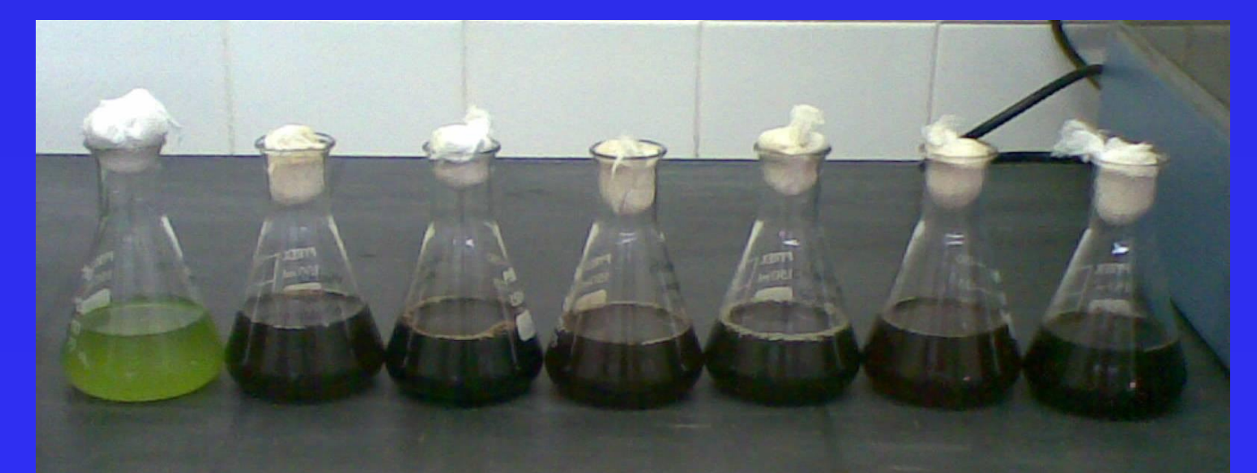
Fig 3 - Bioensaios líquidos de Chlorella vulgaris com os diferentes extractos de plantas (1:10)

Os extractos de choupo parecem favorecer o crescimento da Chlorella , sugerindo a presença de polissacáridos e/ou outras substâncias utilizadas no seu metabolismo.