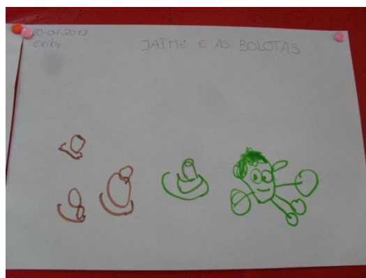
Figura 31: Registo da história

Durante um diálogo, em grande grupo, uma criança perguntou – “Podemos semear as bolotas que temos na sala?” (C8). Uma vez que ainda tínhamos espaço no canteiro dirigimo-nos à horta e semeamos as bolotas.