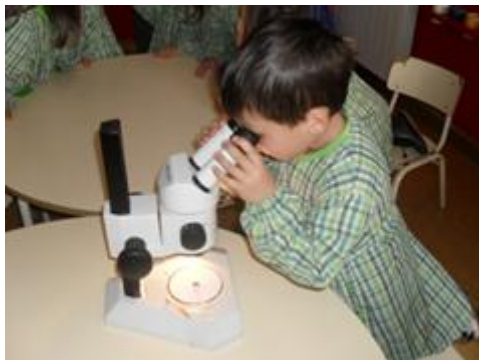
Figura 26: Observação das abelhas

Por todos os motivos mencionados ao longo da descrição das atividades, consideramos que esta experiência de aprendizagem foi bastante significativa para o desenvolvimento e aprendizagem das crianças, permitindo abordar todas as áreas e domínios curriculares para a Educação Pré-escolar.