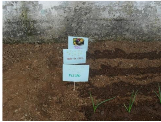
Figura 28: Identificação das sementes

As crianças, durante este processo, tinham de ter um grau de responsabilidade maior, pois tinham de regar as sementes/plantas todos os dias. O grupo também nesta fase já demonstrava ter mais autonomia e querer fazer as coisas sem ajuda. Resolvemos então implementar um quadro do responsável, onde cada criança na sua vez e no seu dia fazia o comboio, regava a horta e dava o leite aos colegas. Este quadro teve um efeito positivo porque levou a que algumas crianças não quisessem faltar por terem a responsabilidade que nesse dia lhes cabia.