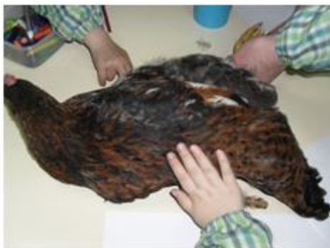
Figura 15: Crianças em contacto com a galinha

Ao longo das atividades que desenvolvemos, fomos introduzindo novo material e vocabulário que o denominava, como no caso da lupa binocular (figura 16), que nos permitiu observar as características das penas da galinha. Esta foi uma atividade que entusiasmou as crianças e que nós reconhecemos isso importante para iniciar as crianças na atividade científica.