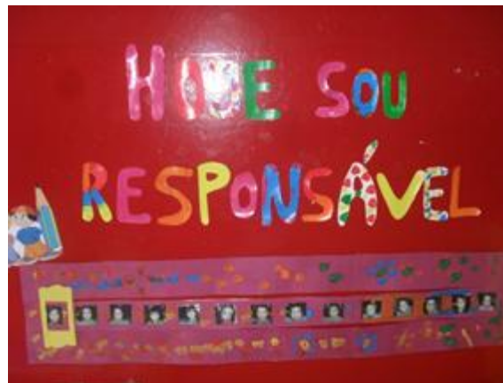
Figura 29: Elaboração do quadro da responsabilidade

As crianças, durante este processo, tinham de ter um grau de responsabilidade maior, pois tinham de regar as sementes/plantas todos os dias. O grupo também nesta fase já demonstrava ter mais autonomia e querer fazer as coisas sem ajuda. Resolvemos então implementar um quadro do responsável, onde cada criança na sua vez e no seu dia fazia o comboio, regava a horta e dava o leite aos colegas. Este quadro teve um efeito positivo porque levou a que algumas crianças não quisessem faltar por terem a responsabilidade que nesse dia lhes cabia.