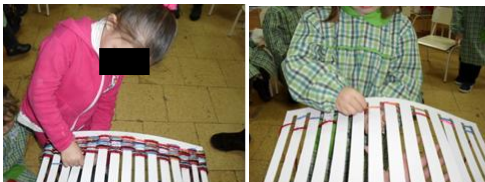
Figuras 12 e 13: Atividade de formar padrões

Dialogámos sobre outras coisas que se poderia fazer com lã, falando de tapetes, colchas, etc. Visualizámos também algumas imagens de teares que serviam para tecer a lã e para fazer cobertores e tapetes. Como não conseguimos arranjar nenhum tear, resolvemos construirmos um em cartão. Era diferente, mas permitia que as crianças percebessem a técnica, ou seja, o entrelaçar de fios para a partir da lã fazer tecidos. Foi um novo desafio e este aumentou quando as crianças viram que conseguiam tecer a lã, como as imagens das figuras 12 e 13 permitem perceber.