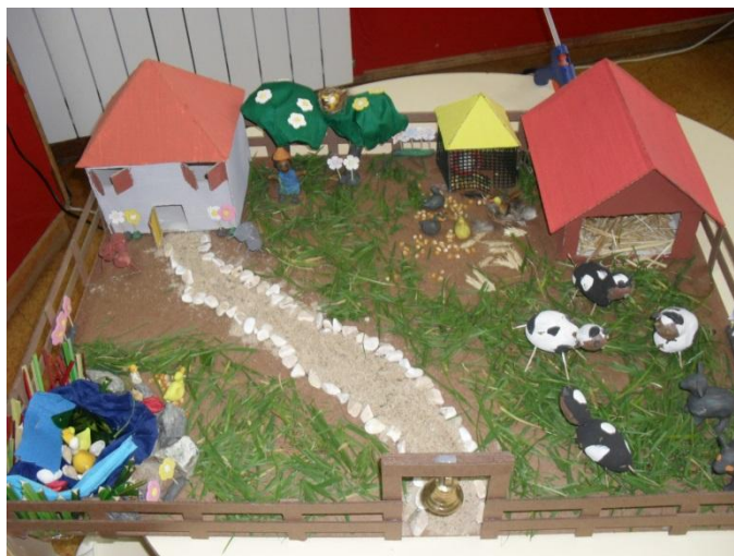
Figura 17: Maqueta da Quinta

trabalhar estes conceitos foi mais fácil as crianças perceberem. Indicavam, por exemplo, que os patos estavam no interior do lago, os burros estavam no exterior deste, e que todos os animais estavam no interior da quinta. A exploração do conceito de fronteira envolveu maior complexidade e para que o grupo percebesse, como a quinta tinha uma cerca a delimitá-la, tirámos partido desse elemento, o que ajudou as crianças a compreenderem.