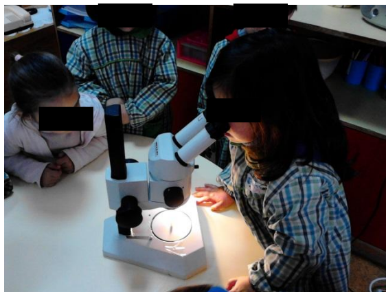
Figura 16: observação da pena à lupa binocular

Foi uma atividade em que as crianças colocaram bastantes questões e, algumas delas, depois de observar quiseram repetir várias vezes, porque como lupa binocular amplia, eles questionavam-se como era possível. Segundo informação das crianças e da educadora era a primeira vez que estavam a contactar com aquele material (sendo de lembrar que era o primeiro ano de frequência da instituição).