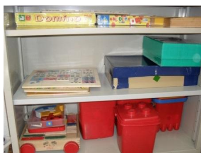
Figura 5: Área dos Jogos

A área dos jogos encontrava-se ao lado da área das construções e dispunha de uma mesa circular com quatro cadeiras e uma estante na qual se encontravam diversos tipos de jogos (figura 5), como: dominós, blocos lógicos, puzzles e cartas, entre outros. Esta área possibilitava às crianças realizarem jogos que favoreciam o pensamento lógico e a sua implicação na descoberta e na resolução de problemas.