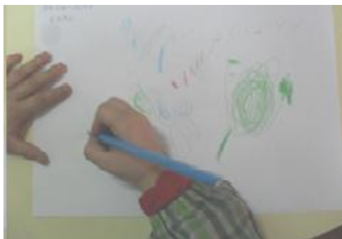
Figura 21: Registos da visita à ESA

Como forma de recordar e atribuir significado à visita, de regresso ao jardim-de-infância, propusemos ao grupo que realizasse, em tempo de trabalho em pequenos grupos, o registo da atividade (figura 21).