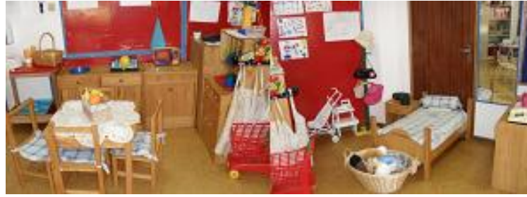
Figura 3: Área da Casa das Bonecas

Verificámos que a diversidade de materiais colocados à disposição das crianças, lhes oferecia diferentes possibilidades de “fazer de conta”, permitindo-lhes “recrear experiências de vida quotidiana, situações imaginárias e utilizar os objectos livremente, atribuindo-lhes significados múltiplos” (ME/DEB, 1997, p. 60).