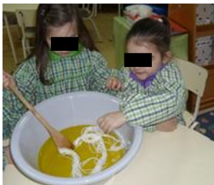
Figura 11: Atividade de tingir lã

Aproveitámos ainda parte deste material (lã tingida pelas crianças) para enriquecer a realizar trabalhos para a decoração da sala, reconhecendo a importância da estética da sala, para que se possa criar um ambiente acolhedor e que documente o trabalho que se desenvolve, como se defende no âmbito do modelo Reggio Emilia .