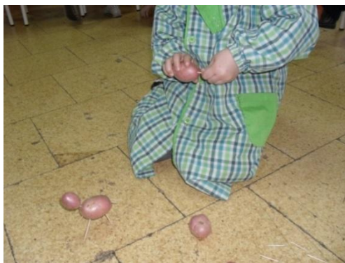
Figura 14: Fazendo figuras de animais, utilizando batatas

Aproveitámos a oportunidade para abordar a alimentação de alguns animais domésticos e referir que as batatas também são importantes para a nossa alimentação. Dialogámos com as crianças sobre o que estas sabiam sobre as batatas e explorámos as suas características (cor, textura, sabor...).