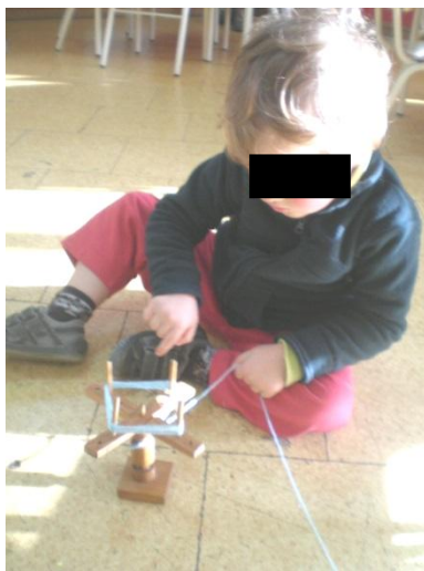
Figura 10: Dobar da lã

Pensámos tirar partido deste material para exercitar a motricidade fina, pelo que propusemos às crianças dobar lã, aproveitando também para ir introduzindo novo vocabulário, como a palavra dobar. Aparentemente, parece ser uma atividade que não oferece grande dificuldade, mas percebemos que não era bem isso que acontecia, revelando algumas crianças dificuldade em fazê-lo. Como a lã estava ficou na sala à disposição das crianças, elas recorriam a ela e integravam-na nas suas brincadeiras. Procurando aprofundar-se a experiência e diversificar as estratégias de intervenção, levámos para sala uma dobadeira em madeira que, embora de tamanho pequeno, permitia ser usada pelas crianças para dobar a lã e, ao mesmo tempo, sensibilizá-las para formas tradicionais de trabalhá-la. Aproveitámos para entoar uma canção, também tradicional, que falava da dobadeira, do novelo e da meada. Recorremos à internet para observar diferentes tipos de dobadeiras, mas foi sobretudo o uso daquela que colocámos à sua disposição que suscitou desejo de fazer, como a imagem apresentada na figura 10 permite perceber.