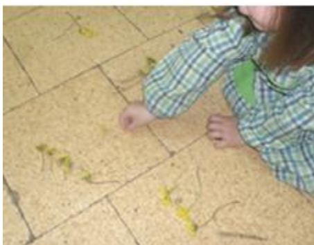
Figura 22: Formação de conjuntos

Uma vez que estávamos a explorar o mel, as crianças perguntavam se iriam provar mel, praticamente nenhuma tinha tido essa oportunidade. Até que a criança C13 perguntou “Podes trazer mel para nós provarmos?”