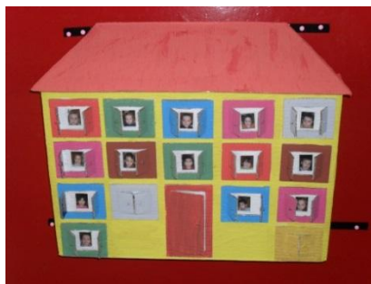
Figura 1: Quadro das Presenças

Um dos instrumentos utilizado, diariamente pelas crianças, foi o quadro das presenças. Este apresentava a configuração de uma casa, constituída por tantas janelas quanto o número os elementos do grupo. Estas serviam de suporte para a fotografia das crianças, como podemos ver na figura 1, o que possibilitava reconhecerem visualmente os colegas e associarem a abertura das janelas à sua presença e, caso isso não acontecesse, poder pensar e tentar identificar quem estava ausente.