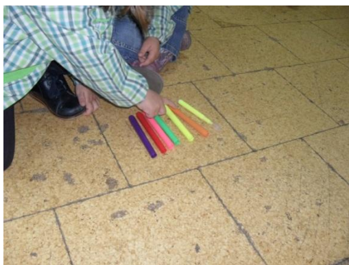
Figura 30: Atividade de contagem

No final da história, trabalhamos a matemática. As crianças tinham de utilizar a memória, pois o objetivo era utilizarem um objeto da sala para cada vez que o Jaime teve de semear a bolota e no fim fazer a contagem.