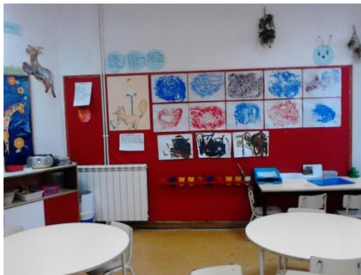
Figura 8: Área da Expressão Plástica

Aqui as crianças tinham à sua inteira disposição diversos materiais, uma grande variedade de tintas e pincéis, diversos tipos de lápis, massa e plasticina. O grupo de crianças, nestas áreas podia explorar o seu lado mais artístico. Serviu também para que as crianças desenvolvessem diversas aptidões. Esta área proporcionou ao grupo diversas oportunidades a nível da exploração e manipulação de diferentes materiais, que permitiu a expressividade às crianças, bem como criar estruturas bidimensionais e tridimensionais. Procurámos, assim promover a iniciativa e a progressiva autonomia ao grupo.