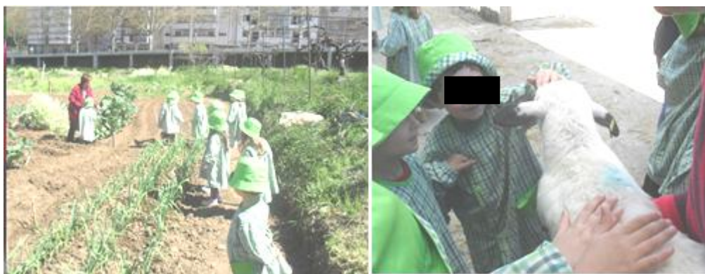
Figuras 19 e 20: Visita ao espaço exterior da ESAB

Em finais do mês de março, e porque o tempo já não estava tão frio e chuvoso, realizámos uma visita aos espaços da Escola Superior Agrária de Bragança, dando continuidade ao trabalho que vínhamos a desenvolver com o grupo. Esta visita decorreu em conjunto com outros grupos do jardim-de-infância e possibilitou observar e ter contacto com alguns animais que aí havia. Tentámos que o grupo identificasse e reconhecesse alguns aspetos e características físicas e modos de alguns desses animais. Pretendemos também que observassem algumas sementeiras nas hortas que aí havia.