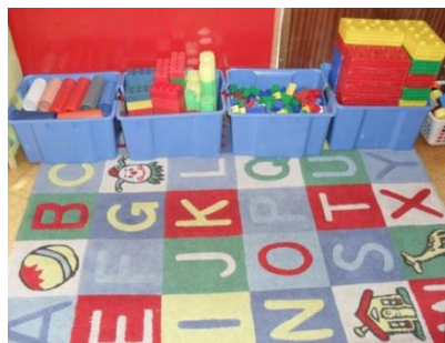
Figura 4: Área das Construções

A área das construções permitia que as crianças elaborassem as mais diversas construções, para isso era equipada de legos com diversas formas e tamanhos e também materiais com diferentes formas de encaixe (figura 4). Notámos que a vivência de experiências que se realizavam, nesta área, possibilitava a interação e a resolução de problemas entre as crianças.