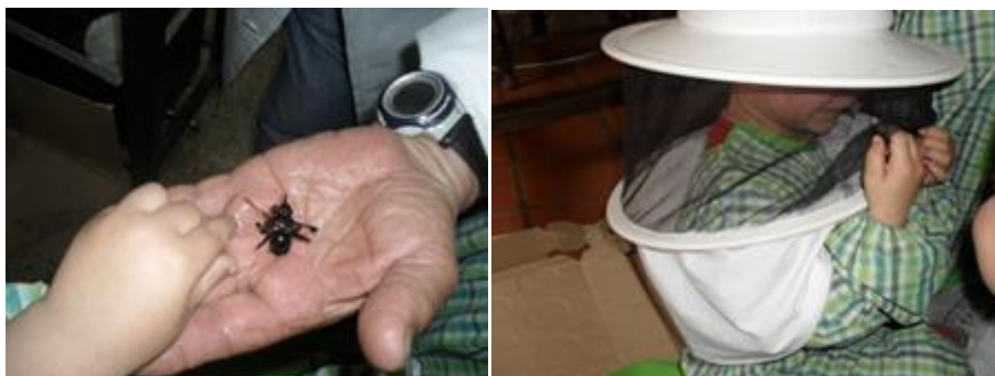
Figuras 24 e 25: Visita à Casa do Mel

abelhas (figura 24), suas características físicas e modos de vida, colmeias, fatos de apicultores (figura 25), como se extraia e o mel e também provar mel.