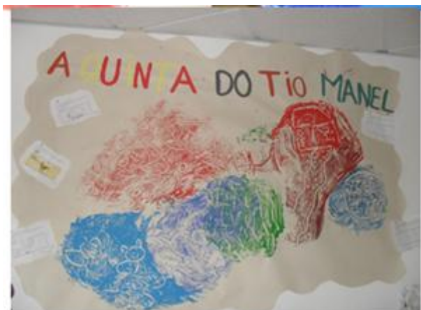
Figura 18: Realização do trabalho em digitinta

Em finais do mês de março, e porque o tempo já não estava tão frio e chuvoso, realizámos uma visita aos espaços da Escola Superior Agrária de Bragança, dando continuidade ao trabalho que vínhamos a desenvolver com o grupo. Esta visita decorreu em conjunto com outros grupos do jardim-de-infância e possibilitou observar e ter contacto com alguns animais que aí havia. Tentámos que o grupo identificasse e reconhecesse alguns aspetos e características físicas e modos de alguns desses animais. Pretendemos também que observassem algumas sementeiras nas hortas que aí havia.