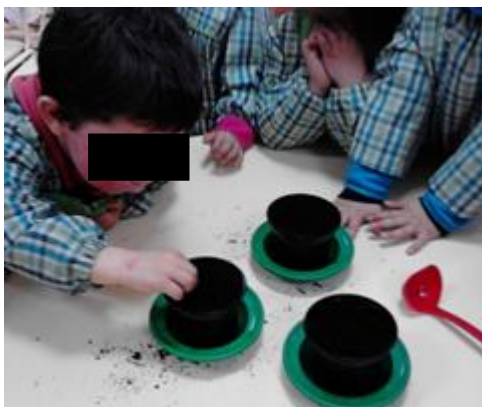
Figura 27: Processo de semear

pegou num vaso, colocou a terra, a semente e depois regou-a. Em seguida, o vaso era colocado ao pé da janela da sala.