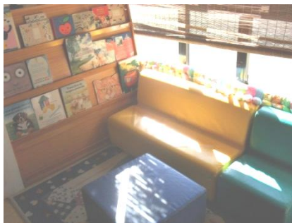
Figura 6: Área da Biblioteca

Quanto à área da biblioteca , esta tinha uma boa iluminação natural, situando-se junto a uma janela (figura 6). Esta área era constituída por uma estante, na qual as crianças podiam encontrar livros diversificados, bem como os livros trabalhados pelas educadoras com as crianças, ao longo do ano. Outros materiais que compunham a área eram três sofás, colocados em cima de um tapete de esponja, de forma a tornar-se o espaço mais aconchegante.