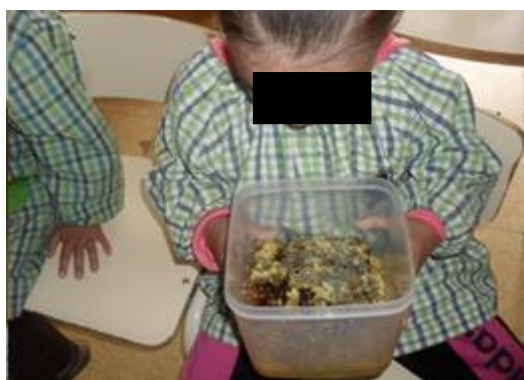
Figura 23: Prova do mel

As crianças também tiveram a oportunidade de ver um favo de mel e provar o próprio favo e o mel, como podemos ver na figura 23.