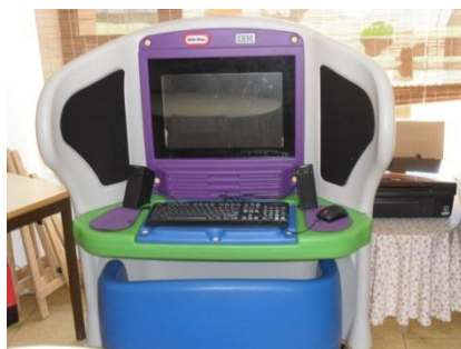
Figura 7: Área do Computador

No que diz respeito à área do computador era composta por um equipamento de kidsmart (figura 7).