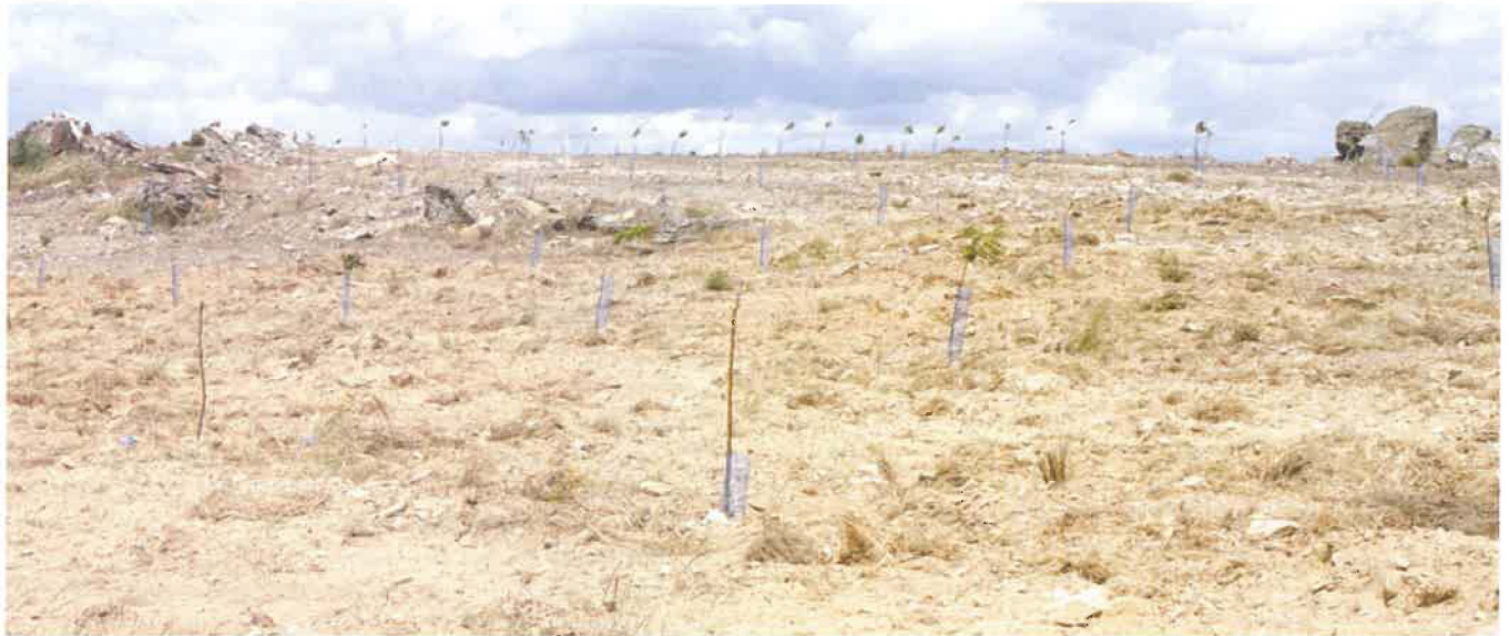
Figura 4. Plantação de castanheiros em solos de fertilidade muito baixa

micorrízicos (quer dos fungos ectomicorrízicos quer dos fungos micorrízicos arbusculares) é facilitarem o acesso ou disponibilizarem fósforo pouco solúvel às plantas hospedeiras (Lopes et al., 2020; Rodrigues et al., 2021). Por outro lado, em solos de características idênticas àqueles em que se encontra o castanheiro, muitas outras espécies têm mostrado falta de resposta à aplicação de fósforo (Afonso et al., 2018; Ferreira et al., 2018; Rodrigues et al., 2019). Foi também observado que apenas 18% dos soutos do distrito de Bragança mostraram níveis de fósforo na zona de deficiência e que a exportação do nutriente nos frutos é baixa (Arrobas et al., 2018). Assim, não se pode concluir que não deve ser aplicado fósforo aos castanheiros, mas em termos relativos ele será necessário em menor quantidade que o azoto e é de menor relevância a necessidade de ser aplicado todos os anos.