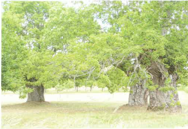
Figura 3. Árvores centenárias em soutos com árvores esparsas