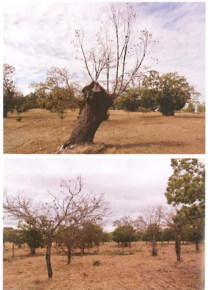
Figura 2. Árvores adultas destruídas pelas doenças

Os maiores problemas do setor estão relacionados com as doenças e pragas da cultura. O cancro-do-castanheiro [ Cryphonectria parasitica (Murr.) Barr] que debilita as árvores podendo levar à sua morte (Murolo et al., 2019) e a doença da tinta ( Phytophthora cinnamomi Rands) que conduz a uma morte rápida dos castanheiros (Gouveia et al., 2009) são as doenças mais importantes (Figura 2). Mais recentemente surgiu também a vespa-das-galhas-do-castanheiro ( Dryocosmus kuriphilus Yasumatsu) de origem asiática (Gençer e Mert, 2019), que está a deprimir fortemente as árvores e a levar a perdas de produtividade consideráveis. Se não fossem os preços tão favoráveis da castanha e o castanheiro ser a única alternativa cultural destes territórios, estas questões sanitárias já teriam, por certo, levado ao abandono integral da cultura. No entanto, os produtores insistem na renovação dos soutos surgindo com isso a necessidade de os fertilizar.