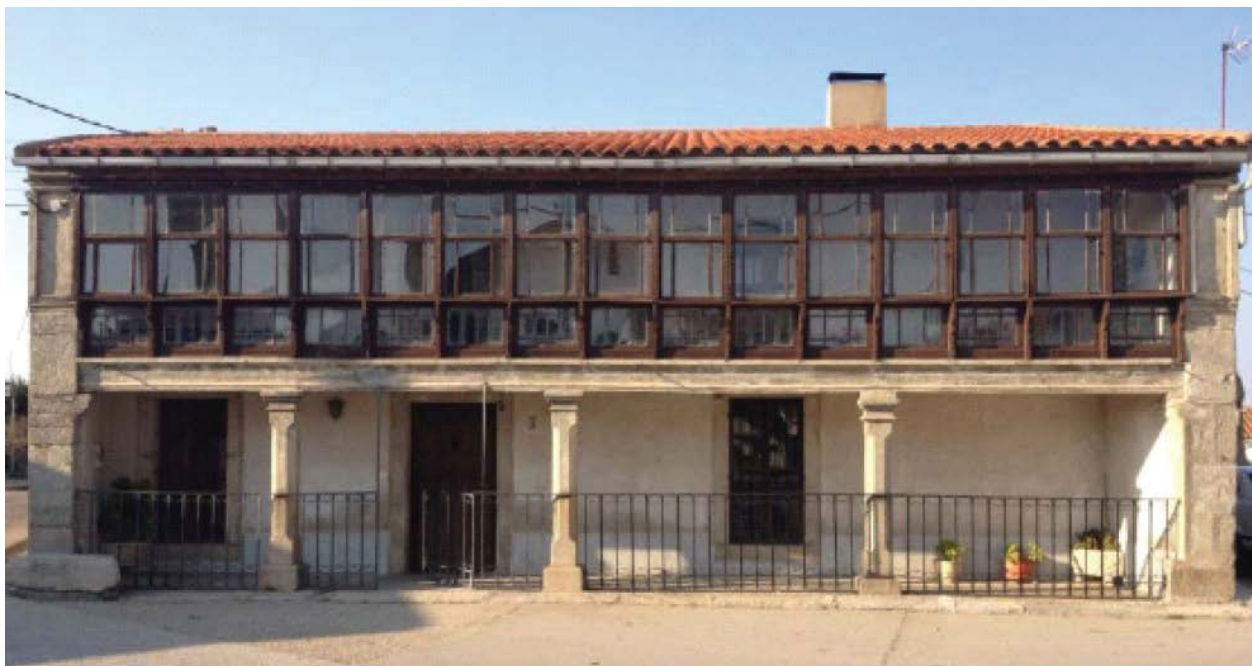
Figura 1: Exemplo de Estufa Anexa: Gáname - Espanha

A Estufa Anexa (Figura 1) é uma solução bioclimática muito característica das casas tradicionais na região Norte de Portugal – Castela e Leão em estudo, à qual ainda nos dias de hoje se recorre com bastante frequência com o objetivo de melhorar as condições de conforto dos espaços interiores.