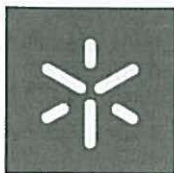
Universidade do Minho