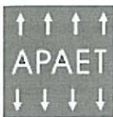
Associação Portuguesa de Análise Experimental de Tensões