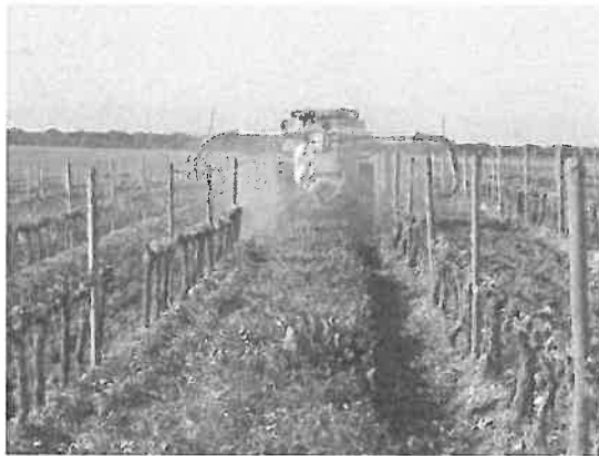
Figura 6.13 - Sistema de gestão do solo em vinha em que se mantém coberto vegetal alternado com mobilização para facilitar a transitabilidade de equipamentos e pessoal na linha enrelvada