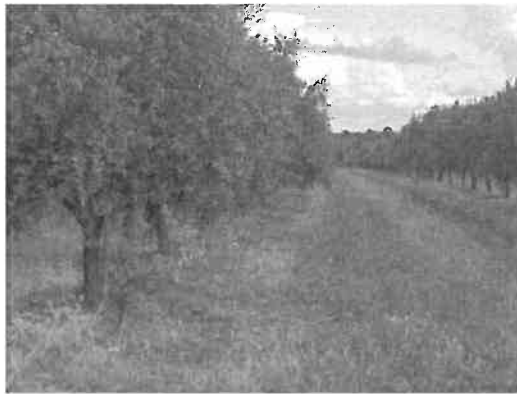
Figura 6.14 - Coberto vegetal semeado com gramíneas em olival de regadio

incorporação de biomassa no solo e os teores em matéria orgânica. Como o pomar é regado, os riscos de redução da produtividade devido à competição pela água são menores.