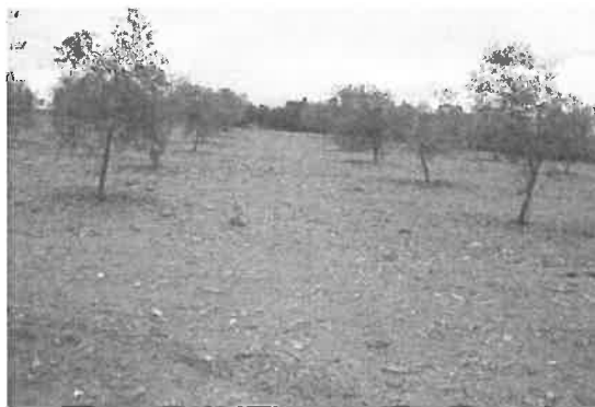
Figura 6.6 - Solo mantido permanentemente nu durante todo o ano em olival com aplicação outonal de um herbicida que combina substâncias ativas de ação residual e pós-emergência

ação residual) para eliminar a vegetação não controlada pelo herbicida residual de Outono e as novas emergências de Primavera.