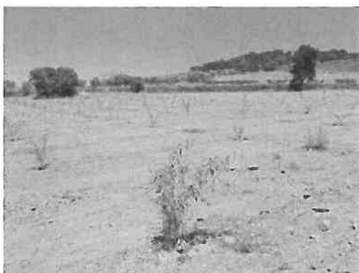
Figura 6.1 - Aspeto de um pomar recém-instalado de amendoal após uma mobilização de Primavera

sistemas de manutenção do solo que preveem uma maior permanência de vegetação herbácea natural ou semeada nos pomares e em que as mobilizações e/ou a aplicação de herbicidas perdem significado ou são integralmente abandonadas.