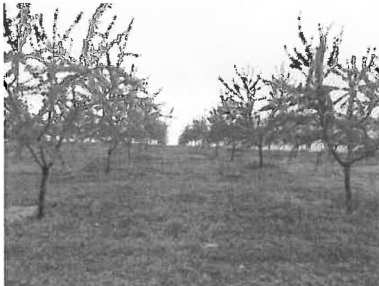
Figura 6.10 - Coberto de vegetação natural em amendoal jovem de sequeiro gerido com a aplicação de um herbicida pós-emergência aplicado no início da Primavera