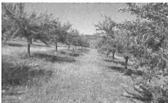
Figura 6.5 - Pomar tradicional de amendoeira gerido exclusivamente com aplicação de herbicidas

fruticultura. No caso dos pomares, a substituição das mobilizações pela aplicação de herbicidas foi possível após se ter tomado consciência de que o papel das mobilizações é basicamente apenas combater a vegetação espontânea (Figura 6.5).