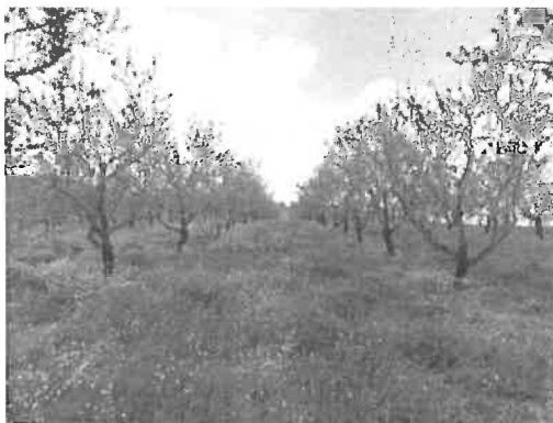
Figura 6.2 - Pomar adulto de amendoal de sequeiro na Primavera mostrando desenvolvimento exuberante de vegetação herbácea antes de aplicação de medidas de combate

A gestão do solo não é um aspeto menor na técnica cultural de um pomar uma vez que se reveste de elevada importância económica