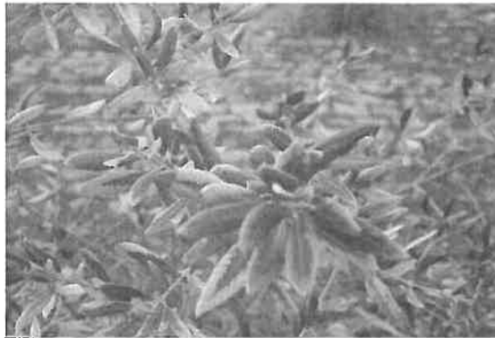
Figura 6.7 - Sintomas de toxicidade em folhas de oliveira após aplicação de um herbicida à base de diurão, terbutilazina e glifosato em dose provavelmente elevada

espectável que ocorra reversão da flora infestante, isto é, tendem a dominar o coberto um reduzido número de espécies tolerantes aos herbicidas utilizados (Figuras 6.7 e 6.8), o que normalmente leva a que aumentem as dificuldades do combate e à necessidade de mudar de substância ativa. Os equipamentos de aplicação de herbicidas devem estar em perfeitas condições e devidamente calibrados antes de serem utilizados.