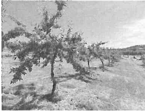
Figura 6.9 - Coberto de vegetação natural em amendoal jovem irrigado gerido com corte