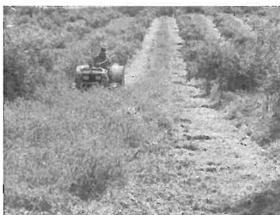
Figura 6.16 - Ervilhaca cultivada para sideração em olival biológico

capacidade de fixação de azoto destas plantas, que pode ultrapassar 150 kg/ha/ano de azoto, mesmo em solos pobres (Rodrigues et al. , 2013b; 2015b; Ferreira et al. , 2015), a técnica pode ser usada apenas ano sim ano não para satisfazer as necessidades em azoto do amendoal.