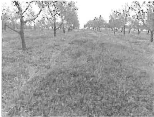
Figura 6.15 - Coberto de leguminosas anuais de ressementeira natural em pomar adulto de amendoeira conduzido em sequeiro