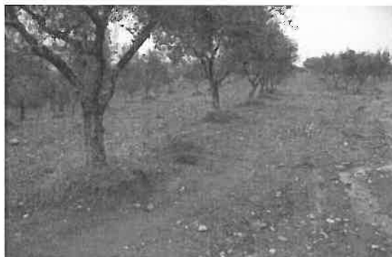
Figura 6.3 - Erosão hídrica em olival com perda de fertilidade do solo por redução da sua espessura efetiva

a sua capacidade de infiltração originando escoamento superficial e arrastamento de solo), declive elevado (frequente, por exemplo, no interior norte de Portugal) e elevado comprimento do declive (isto é parcelas grandes continuamente cultivadas, por exemplo no sul de Portugal). Acresce que de uma maneira geral a copa das árvores fornece cobertura limitada ao solo, sobretudo quando os pomares são jovens e no caso da amendoeira por ser uma árvore de folha caduca. Nestas condições, o solo está completamente exposto à ação das gotas da chuva durante grande parte do ano.