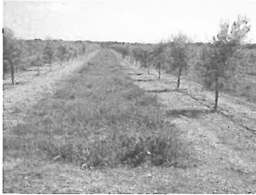
Figura 6.12 - Gestão da vegetação em olival de regadio com aplicação de herbicida na linha e corte da vegetação na entrelinha

Embora menos habitual, por vezes o solo é mantido com sistema de mobilização mínima em que junto às árvores se aplicam herbicidas e na entrelinha se passa o escarificador, orientado o trabalho de forma perpendicular ao maior declive para favorecer a infiltração da água da chuva e reduzir a perda de solo por erosão. Este sistema pode também ser utilizado para cultivar plantas (leguminosas ou misturas) na entrelinha para enterrar como adubo verde (Arquero e Serrano, 2013).