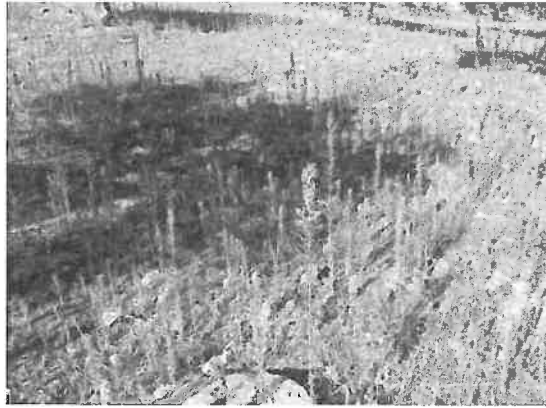
Figura 6.8 - Coberto dominado por plantas do género Conyza após gestão da vegetação com um herbicida à base de glifosato durante vários anos

Por vezes são usados exclusivamente herbicidas pós-emergência como método de gestão da vegetação. Nestes sistemas permite-se o desenvolvimento de vegetação herbácea durante o Inverno, com papel importante na proteção e melhoria na fertilidade do solo, sendo a vegetação destruída durante a Primavera para reduzir a competição da vegetação pelos recursos hídricos. A vegetação seca queimada pelo herbicida confere alguma proteção ao solo durante o Verão. Este sistema de gestão do solo quando bem aplicado tende a aumentar a produção e a produzir bons indicadores de fertilidade do solo (Rodrigues et al. , 2011; Ferreira et al. , 2013). O assunto será retomado no ponto 6.5.