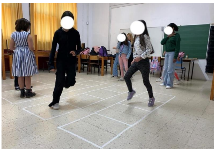
Imagem 4 - Realização da atividade «La anaconda»

O momento mais gratificante foi perceber que as alunas estavam tão envolvidas que solicitaram repetir a atividade várias vezes, o que acabou por prolongar o exercício durante toda a aula. A inclusão dos instrumentos Orff trouxe um elemento adicional de diversão e desafio, que foi bem acolhido. No final, as alunas expressaram um grande apreço pela atividade, mencionando que se sentiram conectadas umas às outras e com a música de forma única. Como foi uma aula tão motivadora, tanto para mim enquanto professora estagiária como para as alunas, deixo nos anexos a planificação desta mesma aula.