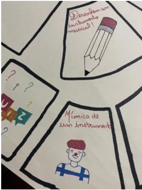
Imagem 2- parte do «jogo da glória»