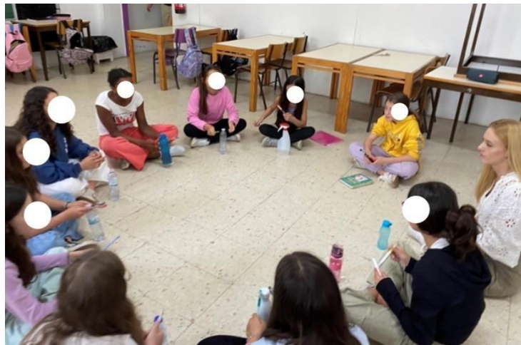
Imagem 6.- Realização da atividade de percussão corporal «Beginin´»

expressão artística quanto como ferramenta para o desenvolvimento humano.