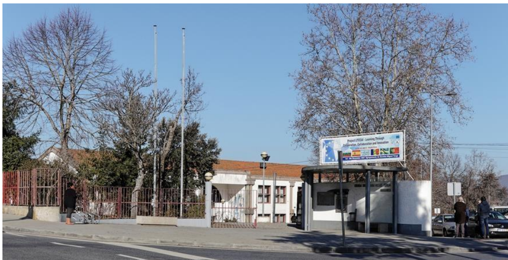
Imagem 1- Fachada do local da PES.

O local conta também com instalações bem equipadas, incluindo salas de convívio, uma biblioteca, um auditório e espaços desportivos, que contribuem para um ensino dinâmico e interativo. A prática pedagógica nesta instituição é orientada por princípios de inclusão, inovação e sucesso educativo, criando oportunidades de aprendizagem que respeitam as necessidades e os ritmos de cada aluno.