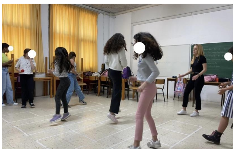
Imagem 5 - Realização da atividade «La anaconda»