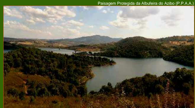
Paisagem Protegida da Albufeira do Azibo (P.P.A.A.)

Na fase de planificação efectuou-se uma visita à P.P.A.A. com o objectivo de reconhecer e seleccionar a área onde se iriam implementar as actividades planeadas. Este processo teve a colaboração de uma professora responsável pela Ecoteca de Macedo de Cavaleiros, cuja participação consistiu na identificação e selecção dos aspectos mais representativos do espaço natural protegido. A actividade concretizou-se no dia 8 de Fevereiro de 2008. Ao longo do dia as crianças puderam contactar com diversos espaços e experimentar sensações, através da visualização e manipulação de materiais. No Núcleo Central de Salselas assistiram a uma palestra sobre a fauna e a flora do P.P.A.A., tendo-se seguido uma visita guiada ao museu de arqueologia. Depois do almoço, ao ar livre, o grupo deslocou-se à aldeia de Santa Cominha, onde três grupos de crianças realizaram o percurso pedestre Ricardo Magalhães. No decorrer desta caminhada incluiu um peddy-papper , observação da fauna, flora e rochas que aquele espaço natural protegido engloba. No final da actividade foi entregue a cada criança uma pequena lembrança sobre a temática ambiental e foi oferecido um lanche ao ar livre.