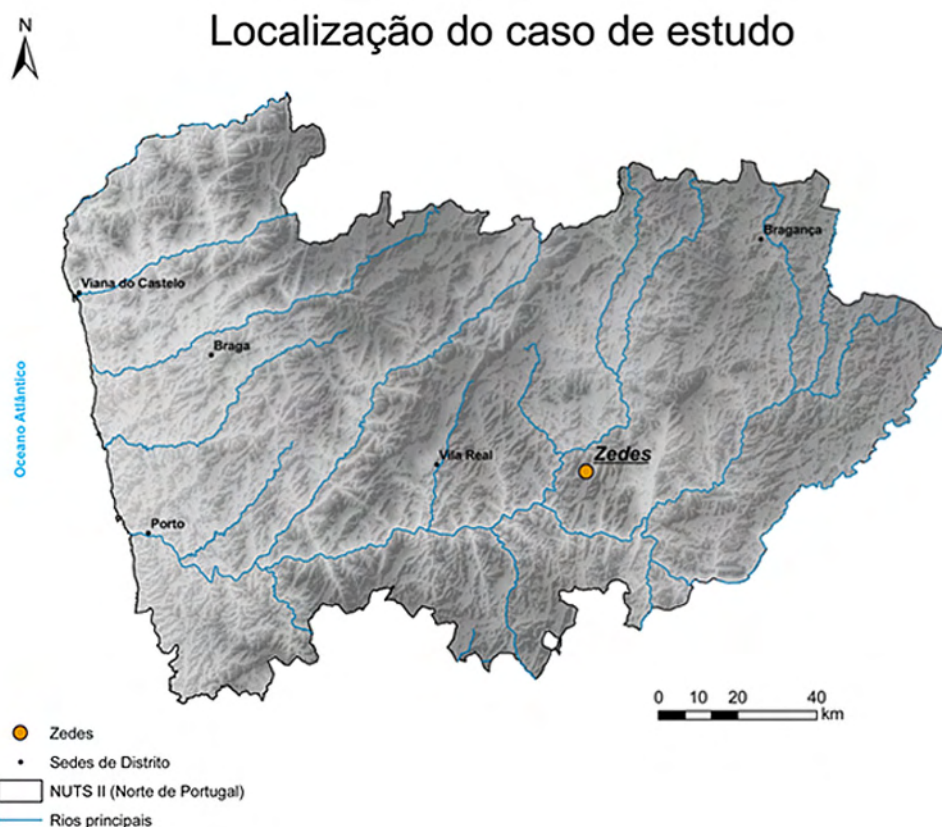
Figura 1 Localização de Zedes no Norte de Portugal”.

Como se referiu na introdução, o estudo de caso, adiante explicitado, centra-se na Freguesia de Zedes (Carrazeda de Ansiães) (vd. figuras 1 e 2), por volta de 1920, e tem por objetivo principal averiguar se a área de monte necessária para alimentar os gados era incompatível com o uso florestal.