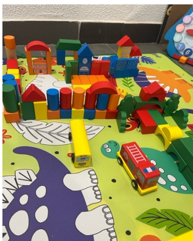
Figura 3. Construção coletiva

Por fim, a quinta criança (E) apresentou sinais de agitação e ansiedade ao longo da atividade. Demonstrou dificuldades em cooperar, insistindo em fazer as tarefas sozinha e recusando, por momentos, a ajuda dos colegas. Em determinado momento, disse: “Eu quero fazer esta parte sozinha, ninguém mexe!” , o que levou a breves momentos de frustração no grupo. No feedback final, reconheceu: “Eu gosto de fazer sozinha, mas foi engraçado ver o que os outros fizeram” , revelando uma percepção inicial da importância da colaboração, ainda que precise de reforço nesta área.