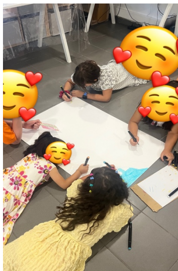
Figura 4. Desenho no mural

Por fim, a quinta criança, habitualmente mais agitada e comunicativa, apresentou alguma dificuldade inicial em manter-se concentrada, mas, com incentivos, conseguiu envolver-se de forma positiva. Identificou-se com uma personagem divertida e brincalhona, partilhando com entusiasmo: “Gosto de todos, mesmo quando são diferentes.” No mural, desenhou um colega com muitas cores e escreveu: “É fixe porque brinca comigo e é engraçado.” Apesar da simplicidade da sua expressão, foi possível reconhecer avanços na forma como começa a valorizar o outro e a reconhecer o impacto das diferenças no convívio.