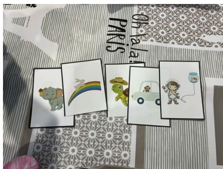
Figura 2. Alguns personagens da história

Através da grelha de observação, verificou-se que a maioria das crianças demonstrou progressos significativos na comunicação eficaz: Criança A – Sim / Não / Sim, Criança B – Sim / Sim / Sim, Criança C – Sim / Sim / Sim, Criança D – Sim / Sim / Sim, Criança E – Sim / Não / Sim.