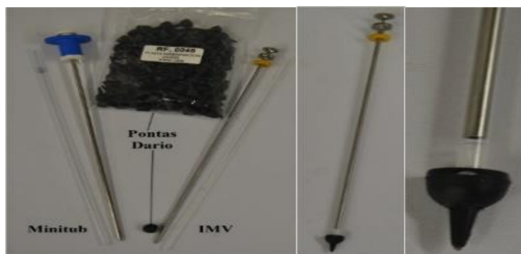
FIGURA 1 – Pistoletes e bainhas da Minitüb® e da IMV® e pontas Dario®.

A deposição do sémen foi feita o mais profunda possível (pistoletes Quicklock®).