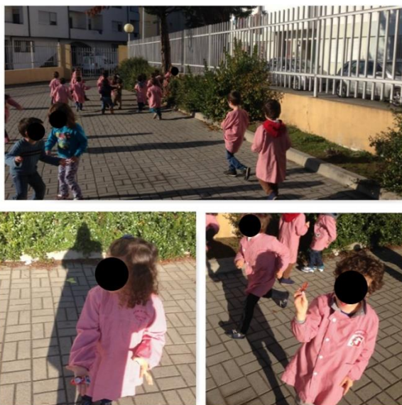
Figura 21, 22 e 23 - Caça ao tesouro

Após este diálogo, sugerimos às crianças que nos deslocássemos até ao exterior, já no recreio, propusemos uma “caça ao tesouro” que consistia na procura de Pais-Natal que estavam escondidos ao longo do espaço. Para uma exploração mais abrangente do exterior, em conjunto com as crianças estabelecemos algumas regras de concordância, para auxiliar a procura, assim sendo optamos por utilizar palavras tais como “quente” que significava perto, e “frio”, que significava longe.