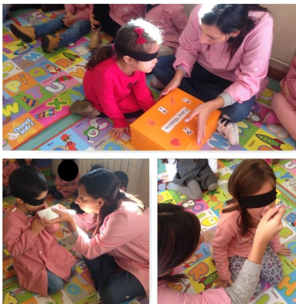
Figura 13, 14 e 15 - Atividade explorando os sentidos

Como podemos verificar, as crianças sabiam identificar, os elementos que caracterizavam cada estação, podemos dar ênfase à criança que diz “ nossa estação ”, pois na verdade ela queria referir-se à estação da atualidade. Este diálogo foi importante para analisar conhecimentos que as crianças tinham acerca do tema, como tal foi fundamental a partilha destes mesmos conhecimentos. Por último, exploramos o sentido da audição, foram reproduzidos vários sons que identificavam o outono, como por exemplo, chuva, vento, folhas a cair entre outros, as crianças tinham que identificar qual a sua ação.