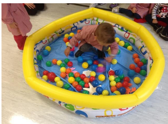
Figura 7- À procura dos animais marinhos

Ainda foram efetuadas outras atividades, nomeadamente um jogo que consistia nos reconhecimentos da imagem de animais marinhos que foram espalhados numa piscina, a atividade tornou-se bastante dinâmica porque a criança teve que entrar dentro da piscina, que por sua vez estava cheia de bolas de plástico, essas bolas serviram para dificultar a atividade, permitindo assim a prática de movimentos corporais, trabalhando desta forma, tanto a motricidade fina como a motricidade grossa.