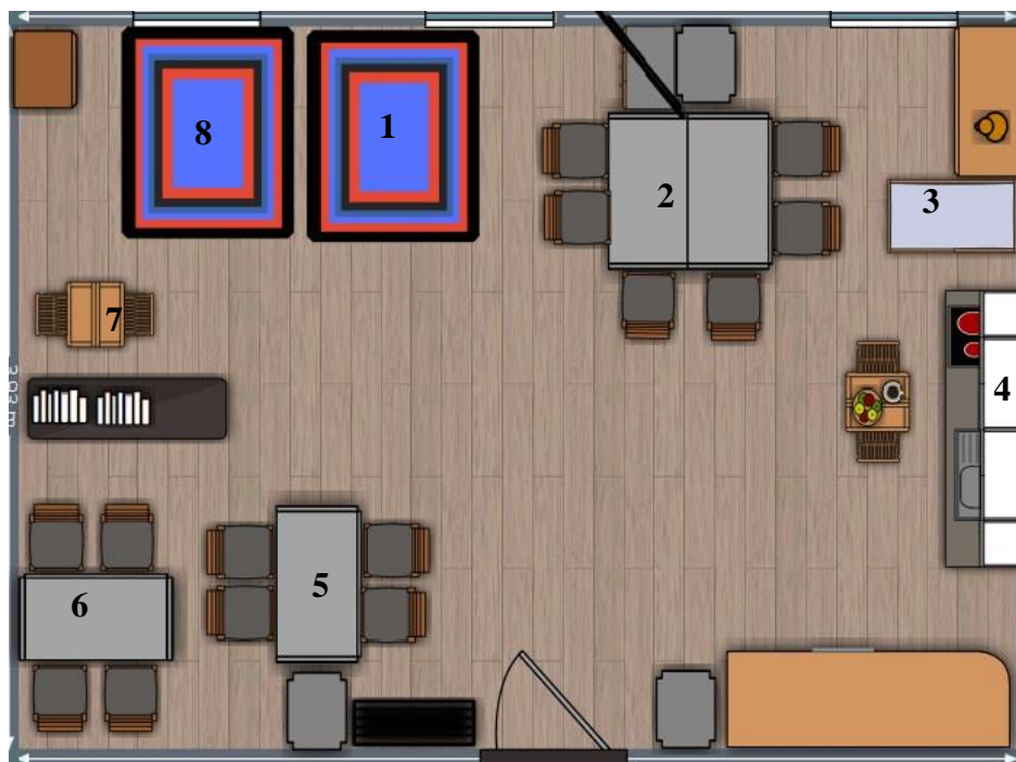
Figura 3- Planta da sala de atividades do Jardim-de-infância