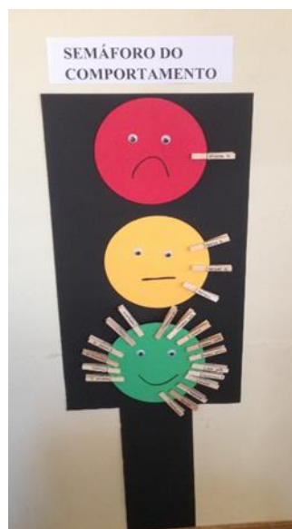
Figura 24 - Semáforo do comportamento

Tal como o quadro da meteorologia, o semáforo do comportamento também passou a ter um espaço importante na sala e passando a fazer parte da sua rotina, ou seja, nenhuma das crianças poderia terminar o dia sem fazer uma reflexão acerca das suas atitudes, assim sendo todas as crianças eram possuidoras de uma mola de madeira que no final do dia deveriam colocar no semáforo de acordo com o seu comportamento, desta forma, definiram que caso o seu comportamento fosse exemplar deveriam colocar a sua mola de madeira no sinal verde, caso tivessem tido alguma atitude menos boa, deveriam colocar a sua mola na luz amarela e por fim se o comportamento fosse reprovatório deveriam colocar a sua mola no sinal vermelho.