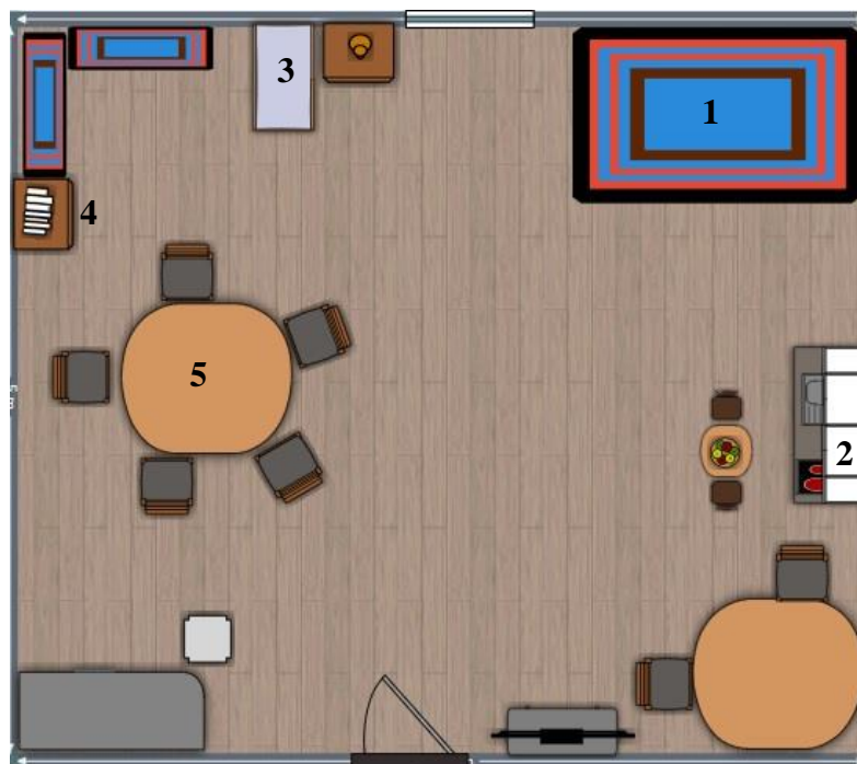
Figura 1- Planta da sala de atividades da sala de Creche

A sala só possuía uma janela, deste modo, a luz natural era escassa. Na sala existia mobiliário adequado às necessidades das crianças: um armário onde se guardavam as capas referentes a cada criança, estojos de cada um entre outros materiais, duas mesas de trabalho, uma televisão, uma cozinha, uma cama das bonecas e um armário dos livros. Para uma melhor compreensão, apresentamos a seguir a figura que ilustra como a sala de atividades estava disposta.