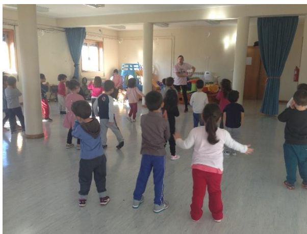
Figura 100 - Atividade de zumba

Posteriormente, iniciamos a atividade principal deste que foi a exploração de um novo espaço, como tal começamos por exemplificar para as crianças os três primeiros passos da coreografia, em que de seguida eles teriam que nos imitar, as crianças revelaram uma grande preocupação em imitar os movimentos representados pela EE, resultando assim movimentos pouco expressivos e fluidos, permanecendo demasiado estáticos, podemos assim dizer que a dança-imitação também surge neste contexto como sendo uma dança onde se interpreta determinada personagem ou se realiza apenas a imitação de ações simples (Sousa A. B., 1980), contudo, após se familiarizarem com os mesmos notou-se claramente que dançavam com prazer e de modo mais expressivo usando todo o corpo em movimento. Salientamos ainda a existência de uma criança com intervenção precoce, que mostrou algumas dificuldades em soltar-se, porém com o decorrer desta atividade podemos deliciar-nos com o seu empenho e interesse demonstrado, resultando assim uma atitude reveladora, desvendando ser uma criança mais confiante e motivada.