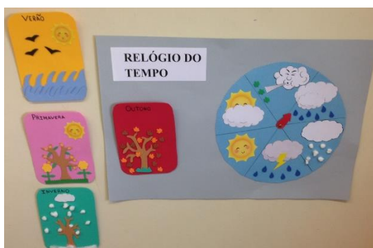
Figura 2 - Quadro do tempo

Durante a nossa prática pedagógica foi-nos possível introduzir alguns instrumentos de pilotagem como o quadro do tempo que surgiu na sequência de uma experiência de aprendizagem, servindo para registrar os estados atmosféricos e as estações do ano. De acordo com Niza (2012) os denominados instrumentos de pilotagem encontrados pela sala pertencem a um conjunto de mapas de registos nos quais as crianças podem planificar, gerenciar, refletir e, assim, avaliar as atividades em que participam durante o dia.