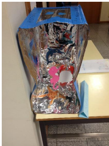
Figura 12 - Exposição do Fundo do Mar

Em suma, remetendo a importância desta atividade para a presente investigação, após o acabamento da mesma, em junção com as crianças fomos colocar o nosso trabalho no hall de entrada da instituição. Esta ação acabou por ter uma importância redobrada, não só por ser uma atividade que respondia ao projeto pedagógico como também serviu de valorização ao espaço e de partilha, não só com os encarregados de educação, como também com a restante comunidade. Silva, et al., (2016, p. 28) referem que a família e a escola são contextos sociais que contribuem para a educação da criança, sendo importante a existência de uma relação efetiva entre estes dois sistemas e menciona ainda os pais como educadores da criança, valorizando os saberes e competências destes para o enriquecimento das situações de aprendizagem. Neste sentido verificamos que a partilha dos trabalhos é defendida pelo Movimento da Escola Moderna, modelo que defende que “(...) é através da afixação de painéis ou da exposição de trabalhos abertos à comunidade. Muitas formas de interpelação e até de intervenção na comunidade poderão ser alimentadas por estas ligações semanais ao quotidiano da vida das populações de origem. (Oliveira-Formosinho, 2013, p.157)