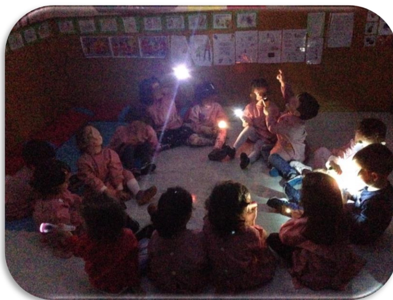
Figura 6 - Crianças a iniciar a atividade

A ideia desta experiência de aprendizagem era descobrir sala através da iluminação com a lanterna. Porém as crianças aperceberam-se também que ao apontarem a lanterna para a EE, esta projetava uma sombra, maior ou menor conforme a distância a que a criança se colocava, tal como acontecia com as imagens que estavam penduradas no teto da sala.