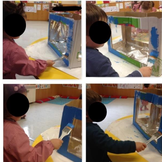
Figuras 8, 9, 10 e 11 – Construção do Fundo do Mar

Esta atividade foi dinamizada em pequeno grupo, enquanto as restantes crianças brincavam nas áreas à sua escolha, uma a uma eram chamadas para começarem a sua criação. Foram utilizados materiais diversificados, tais como uma caixa, tintas, pinceis, areia, conchas e os desenhos dos animais marinhos encontrados na piscina de bolas. Para finalizar este segmento de dinamizações, esta proposta teve como principal objetivo a recriação do fundo do mar, queremos com isto dizer, que houve total liberdade, por parte das crianças de criar um fundo do mar fictício.