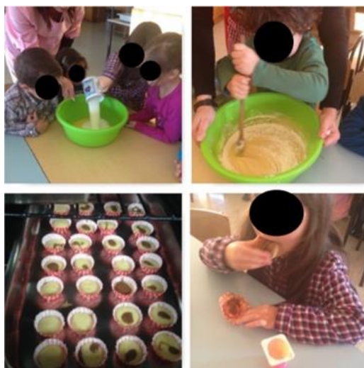
Figura 96, 17, 18 e 19 - Confeção de queques

Em suma, concluímos que esta atividade foi bastante enriquecedora, não só no sentido pessoal como cognitivo, quer isto dizer que o simples facto das crianças entrarem em contacto com outro espaço, ajudou na sua formação pessoal, no que diz respeito às suas atitudes, ou seja, a criança tem que saber que as suas atitudes e comportamento devem estar de acordo com o espaço em que estão inseridas, se na sala podem brincar, se no recreio pode correr, no refeitório aprenderam que é um espaço destinado a confeção de alimentos, onde estão instrumentos perigosos, contudo é um espaço igualmente educacional e por isso mesmo a criança deve aproveitar e vivenciar experiencias que lhe permitam um contacto com situações reais, toda esta situação acabou por ser tornar bastante entusiasmante para as crianças por poderem entrar num espaço novo, principalmente porque provaram algo feito por eles, eles sentiram-se importantes pois sentiram-se capazes de fazer algo que poderia ser oferecido a alguém, o sentido de partilha esteve presente ao longo desta dinamização.