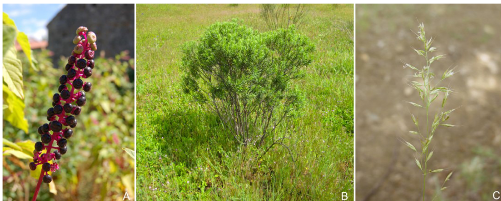
Figura 5. (A) Hierba carmín ( Phytolacca americana ); (B) Torvisco ( Daphne gnidium ); (C) Avena dorada ( Trisetum flavescens ).

Por fin, pueden ocurrir problemas como la calcinosis enzoótica, asociada al consumo de plantas ricas en glucósidos del metabolito activo de la vitamina D, asociada al consumo de plantas como Trisetum flavescens (figura 5C).