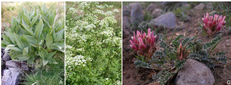
Figura 7. (A) Veratro ( Veratrum album ); (B) Cicuta mayor ( Conium maculatum ); (C) Hierbas locas ( Astragalus incanus ).

Estas plantas pertenecen a diferentes grupos: veratros ( Veratrum spp. ) (figura 7A), que inducen malformaciones craneofaciales principalmente, Conium maculatum y Nicotiana spp. (figura 7B), que inducen artrogriposis, y las denominadas hierbas locas, Astragalus spp. y Oxytropis spp. (figura 7C), que inducen múltiples malformaciones y contracturas fetales. En el vacuno, deberíamos añadir Lupinus spp. que causa la enfermedad del ternero encorvado. Existen otras plantas, que afectan a diferentes funciones u órganos y secundariamente pueden provocar alteración del feto o de la madre y generar abortos, tal es el caso de las plantas bociógenas o las que alteran la absorción de minerales.