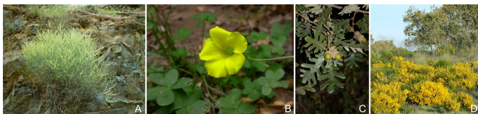
Figura 6. (A) Acedera ( Rumex induratus ); (B) Aleluya ( Oxalis pes-caprae ) (C) Melojo ( Quercus pyrenaica ); (D) Retama negra ( Cytisus scoparius ).

Otras plantas, como Cytisus scoparius (figura 6D) o las del género Cistus (también incluido en 2.2), pueden provocar disuria. Sus principios nefrotóxicos no son bien conocidos.