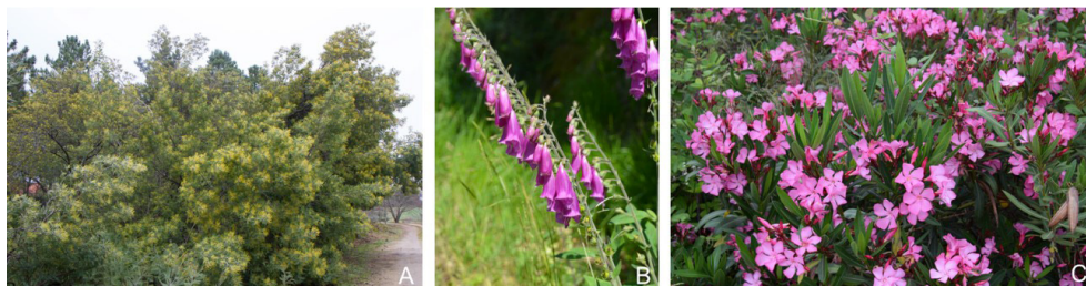
Figura 1. (A) Mimosa ( Acacia dealbata ); (B) Dedalera ( Digitalis purpurea ); (C) Adelfa ( Nerium oleander ).

Las plantas cardiotoxicas (ej. Taxus baccata , Digitalis purpurea (figura 1B), Nerium oleander ; (figura 1C)) contienen glucósidos que actúan sobre el corazón. Entre ellas encontramos algunas plantas cultivadas comúnmente con fines ornamentales y otras silvestres. Sus efectos y usos son conocidos desde hace mucho tiempo, pero no por ello son menos peligrosas. Los glucósidos cardíacos son extremadamente tóxicos, incluso a dosis mínimas, pues alteran la conductibilidad eléctrica del corazón, causando arritmias y la muerte de los animales. El consumo directo de la planta o indirecto, como contaminante de un heno, puede originar en el animal manifestaciones tóxicas cardíacas o extracardíacas, con aumento de la contractilidad cardíaca y, a dosis tóxicas, con inhibición de los sistemas enzimáticos responsables del intercambio iónico a nivel de membrana. Estos cambios conducen a una actividad cardíaca irregular, disminución del gasto cardíaco, arritmias con posible bloqueo aurículo-ventricular y muerte. También, pueden originar gastroenteritis hemorrágica, con diarrea, dolor abdominal, convulsiones y muerte súbita. El diagnóstico se basa en la sintomatología y en el historial de ingestión de la planta, así como en la comprobación de su presencia en el aparato digestivo durante la necropsia. Los glucósidos cardíacos se pueden detectar por cromatografía en sangre, orina y líquido ruminal.