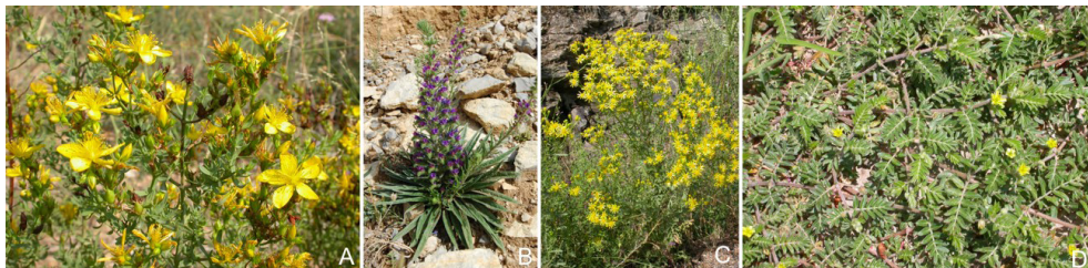
Figura 4. (A) Hierba de San Juan ( Hypericum perforatum ); (B) Viborera ( Echium vulgare ); (C) Hierba de Santiago ( Senecio jacobea ); (D) Abrojo ( Tribulus terrestris ).

La fotosensibilización primaria está causada, principalmente, por plantas que tienen en su constitución pigmentos polifenólicos o furanocumarinas (ej. Hypericum perforatum ) (figura 4A) que, después de ser ingeridos, son absorbidos en el tubo digestivo pasando a la circulación sanguínea y reaccionando con los rayos UV en la superficie de la piel. En este tipo de fotosensibilización, el sistema digestivo absorbe los compuestos fotodinámicos y llegan hasta la piel sin ningún efecto en el hígado del animal. El estudio de la bioquímica hepática no presenta alteraciones relacionadas con el proceso.