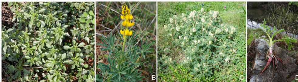
Figura 2. (A) Bledo ( Amaranthus blitoides ); (B) Altramuz amarillo ( Lupinus luteus ); (C) Garbanzo del diablo ( Erophaca baetica ); (D) Nabo del diablo ( Oenanthe crocata ).

Algunas plantas neurotóxicas poseen tiaminasas (ej. Pteridium aquilinum ; Amaranthus blitoides ) (figura 2), o enzimas con actividad similar, destruyendo la vitamina B1 y favoreciendo la presencia de necrosis de la corteza cerebral.