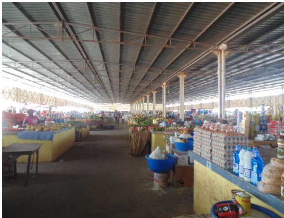
Figura 5: Bancadas do Mercado.

produtos alimentares, oferecendo também uma vasta gama de serviços: transporte (moto táxis/kupapatas 3 ; Candongueiros 4 ); restauração (restaurantes); carregamento (roboteiros); alfaiataria; reparação; entretenimento e câmbio de moeda. O controlo da atividade no mercado é assegurado pela administração do mesmo, que respondem perante a Administração do município, para além de cobrarem as taxas de ocupação diária de espaço que variam entre os 150Kzs (1,128€) para o comércio de menor rendimento - Carvão, rama e outros - e os 350Kzs (2,632€) para os bens industriais, para as a venda de bens alimentares a grosso e para as cozinhas/restaurantes.