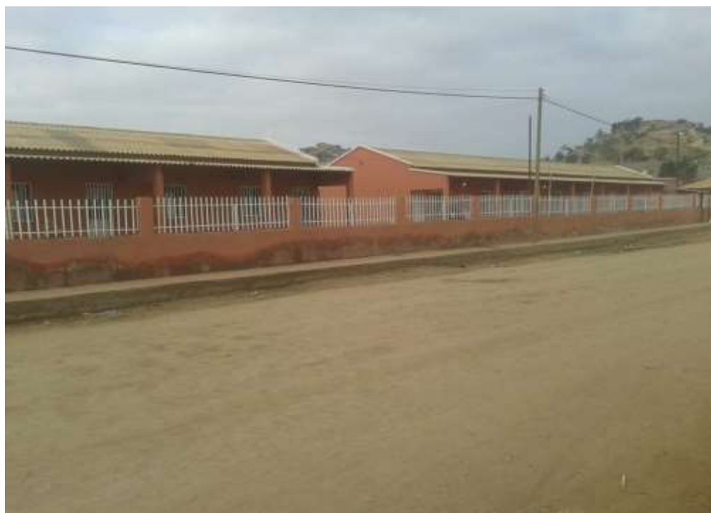
Figura 4: Escolas construídas com o valor cobrado pela Administração do mercado da Bumba.