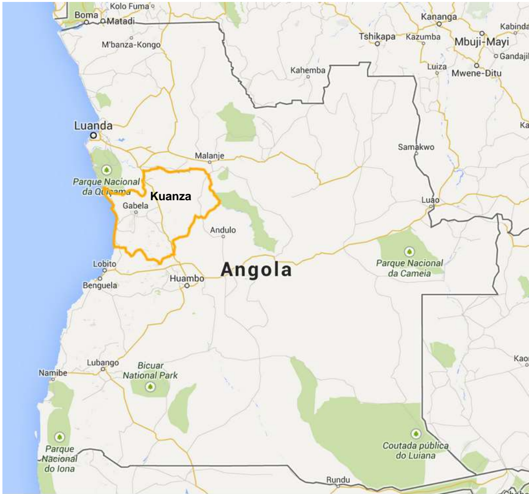
Figura 1: Mapa de Angola onde representa a província do Kuanza Sul.

- é famosa pelas suas pinturas rupestres da época do Neolítico e de ruínas de antigas fortificações.