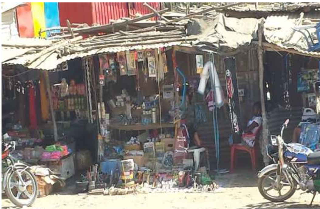
Figura 2: Mercado da Bumba.

De referir que o valor recolhido é gerido pelo Sobado que se responsabiliza pelo pagamento dos salários dos funcionários e outros encargos, e deposita 30.000 Kwanzas (225,6015€) do valor recolhido na Conta da Administração Municipal que se encarrega diariamente da recolha do lixo.