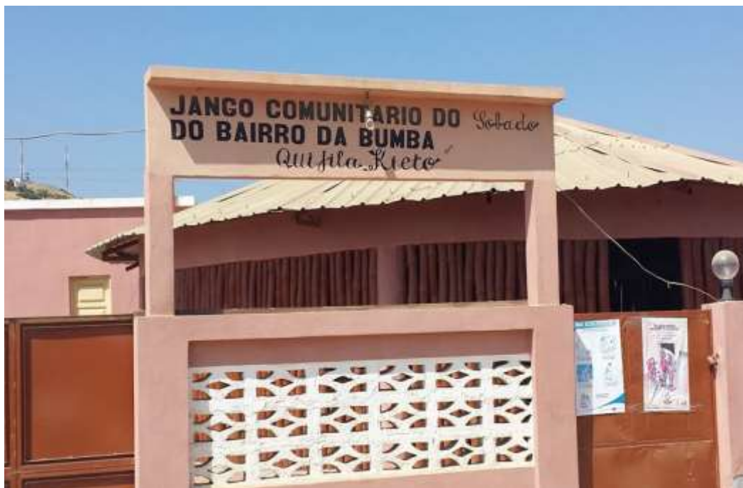
Figura 3: Jango Comunitário do Sobado do Bairro da Bumba.