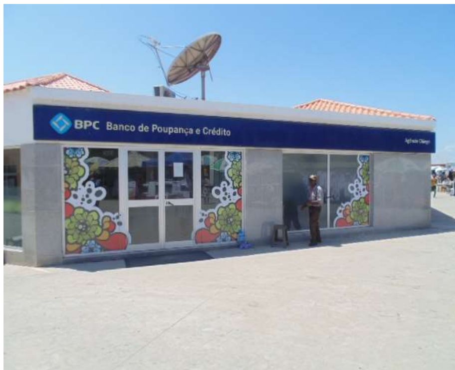
Figura 7: Banco de Poupança e Crédito (BPC).