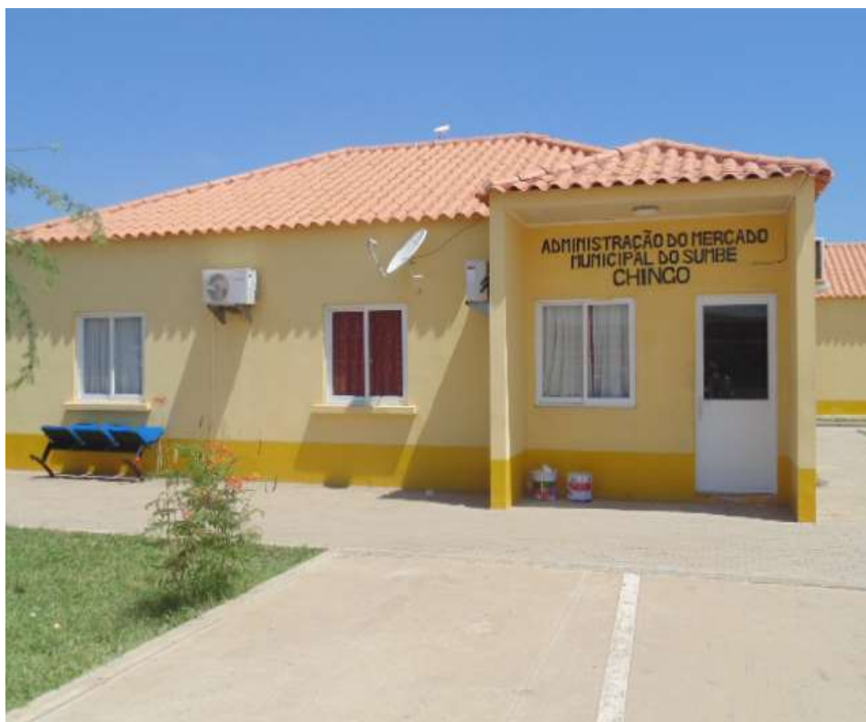
Figura 6: Administração do Mercado do Chingo.

O atual mercado conta com 1 Diretor, 1 Contabilista, 1 Área Administrativa (Finanças, Recursos humanos e Limpeza), 1 Área Técnica e Segurança, 2 Agências Bancárias e 1 parque de estacionamento (ver Figuras 6 a 8). A limpeza é feita por uma equipa de limpeza que conta com 50 trabalhadores que entram às 5 horas e abrem o mercado às 7 horas da manhã e fecham às 19 horas.