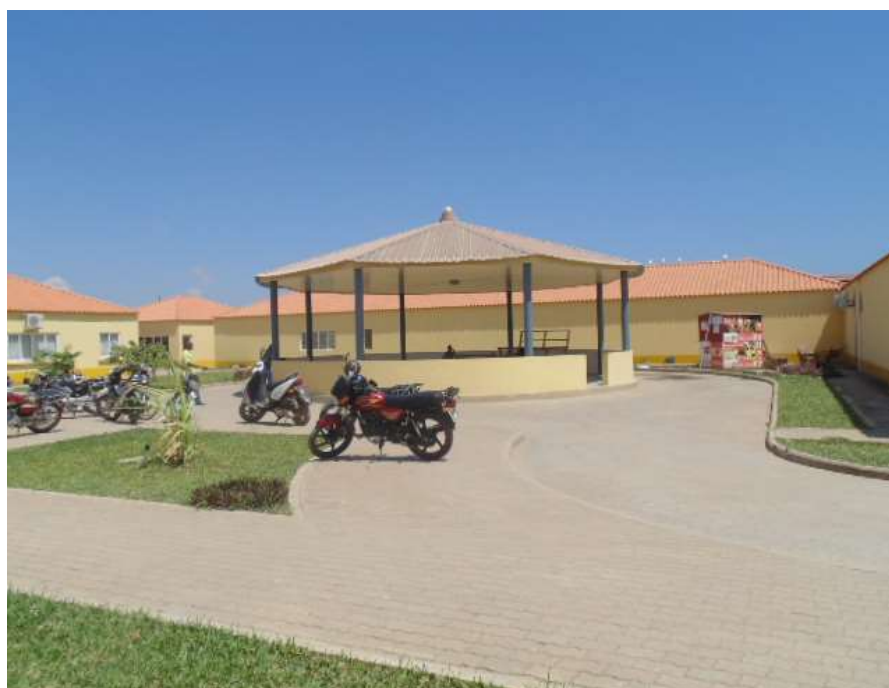
Figura 8: Parque de Estacionamento do Mercado.