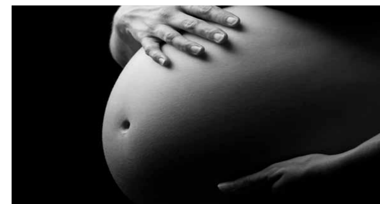
Fig.1 – Gravidez na adolescência no Brasil.

Atualmente a cada mil adolescentes brasileiras entre 15 e 19 anos, 68,4 ficaram grávidas e tiveram os seus bebês, segundo dados do relatório da Organização Mundial da Saúde.