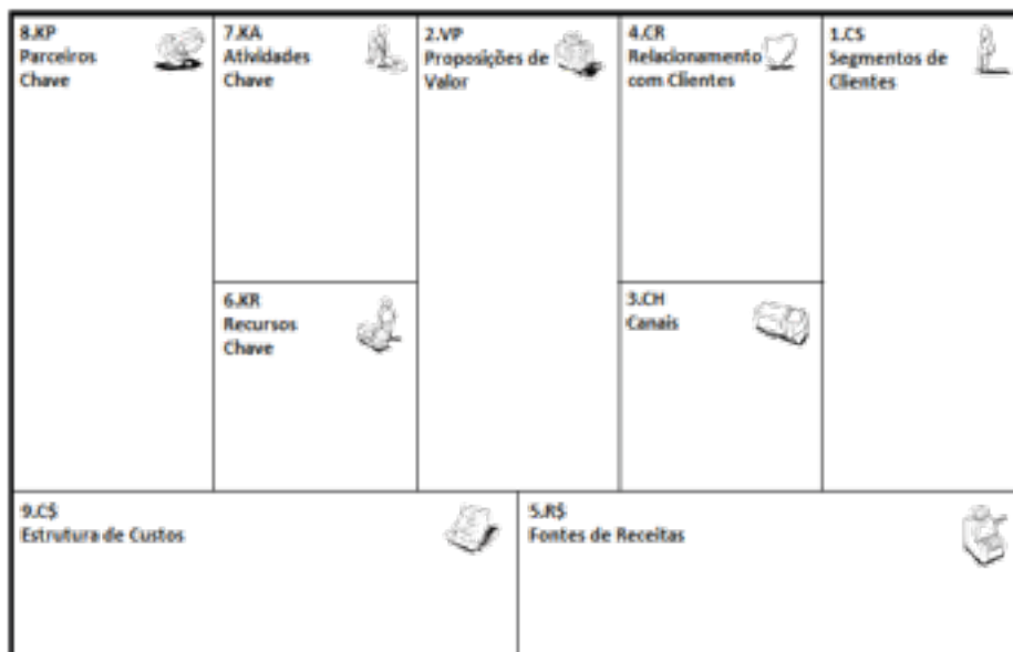
Figura 3 - The business Model Canvas de Alexander Osterwalder (2009)

Na sala 3, partindo do modelo The business Model Canvas de Osterwalder e Pigneur (2009), podemos perspetivar o modelo de negócio, como mostra a figura 3, identificando segmentos de clientes, proposições de valor para esses clientes, canais de distribuição de entrega de produtos ou serviços a esses clientes, formas adotadas para estabelecer relacionamento com os clientes ao nível do produto, preço e promoção, fontes de receita que derivam dessa relação comercial, recursos-chave necessários, atividades-chave cruciais, parceiros-chave para estabelecer parcerias e estrutura de custos que esta componente implica. Existem algumas ferramentas informáticas, mesmo online, para facilitar e automatizar este processo, nomeadamente bmfiddle.com .