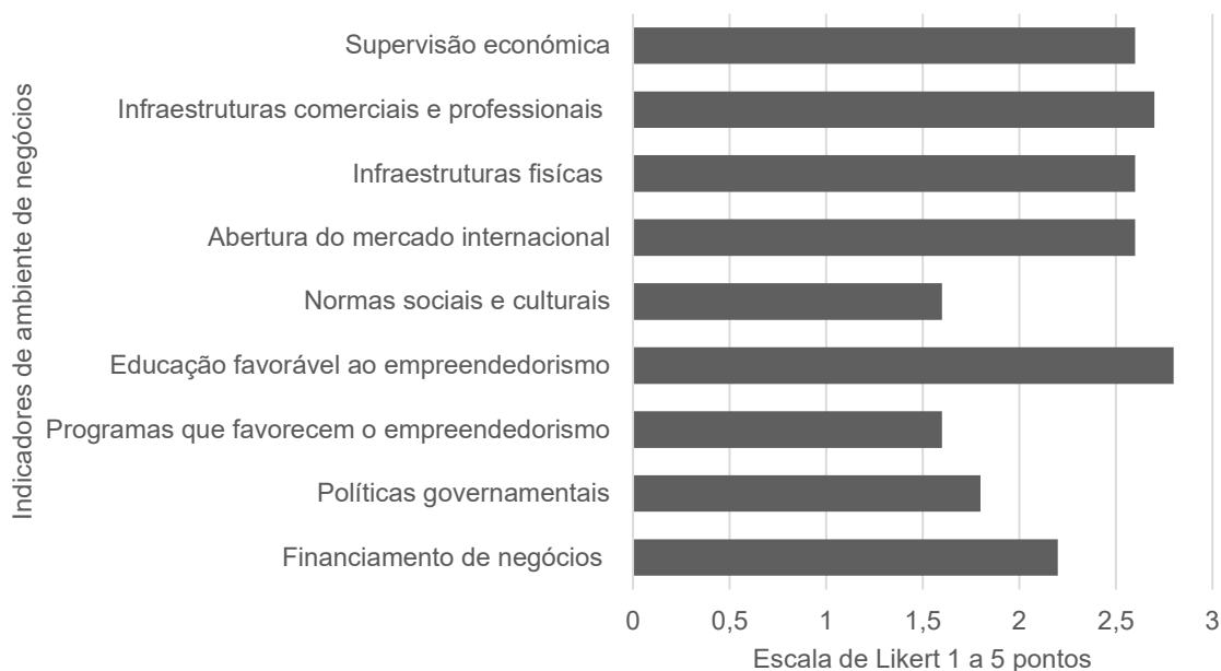
Figura 1. Condições estruturais para o empreendedorismo em Cabo Verde, de acordo com o GEM.