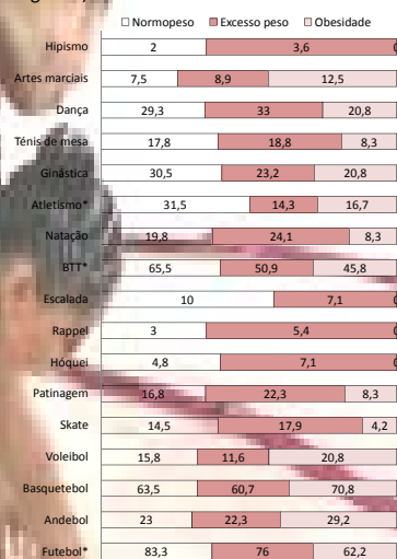
* Existe relação para nível de significância de 0,05 Figura 3 – Prática de modalidades desportivas segundo o IMC

Tendo em conta as classes etárias, constata-se que existe relação entre a idade e a prática de modalidades. As modalidades desportivas praticadas pelo maior número de crianças da classe I (10-13 anos) são o basquetebol (66,5% para 57,8%), a patinagem (20,5% para 12,6%), o hóquei (6,5% para 2,5%) e a ginástica (33,5% para 20,1%). Em todas as outras modalidades desportivas não se verificou a existência de associação (ver figura 2).