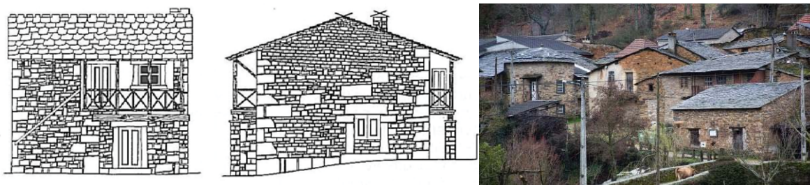
Figura 1 – Alçado principal e lateral da casa típica (Guerra, 1994); casas tradicionais em Montesindeho

A casa típica popular da região transfronteiriça é constituída por paredes de grande espessura em alvenaria de pedra. A pedra era utilizada de acordo com a disponibilidade no local, predominando o xisto e o granito. O granito era a pedra privilegiada para ser utilizada em pontos singulares e de sustentação, tais como os pilares, degraus e ombreiras. A madeira era utilizada essencialmente em pavimentos, coberturas, portas e janelas, sendo o castanho e o carvalho as mais aplicadas. A casa organiza-se normalmente em dois pisos destinando-se o piso térreo a arrecadações, adegas e alojamento de animais, que ajudavam a aquecer os espaços habitáveis situados no nível superior (Figura 1). O primeiro piso é acessível através de uma escada exterior, fazendo-se a circulação horizontal através de uma varanda também exterior. As fachadas, com poucas aberturas para o exterior, proporcionam espaços interiores sombrios. De modo a suprir o desconforto térmico dos rígidos invernos, recorria-se à lareira para o aquecimento do ambiente interior e para cozinhar.