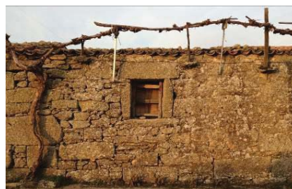
Figura 7 – Sistema de suporte.

O desenvolvimento da vegetação que constitui a Parede Verde pode levar ao aparecimento de anomalias, em geral pouco preocupantes se houver o cuidado de efetuar a manutenção adequada. As anomalias mais graves podem surgir devido à penetração dos ramos em elementos como as paredes e coberturas, proporcionando folgas entre as telhas e alargamento de juntas, e devido ao ataque biológico e químico dos revestimentos. Além dos referidos efeitos mecânicos, a existência de vegetação muito próxima do edifício, cobrindo por vezes as paredes e a cobertura, pode provocar a obstrução de grelhas, algerozes, caleiras e tubos de queda.