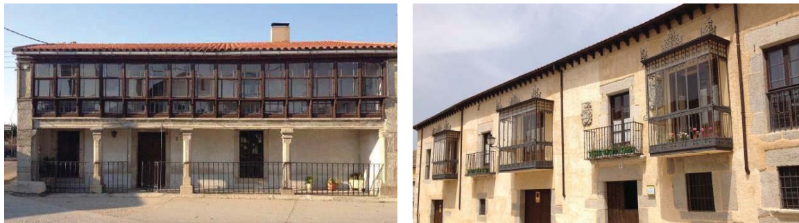
Figura 4 – Estufas Anexas com caixilharia de madeira e de ferro forjado.

A maioria das Estufas Anexas apresenta uma caixilharia em madeira e vidro. Já na região espanhola, para além do uso de madeira, é frequente também o uso de ferro forjado, por vezes bastante trabalhado.