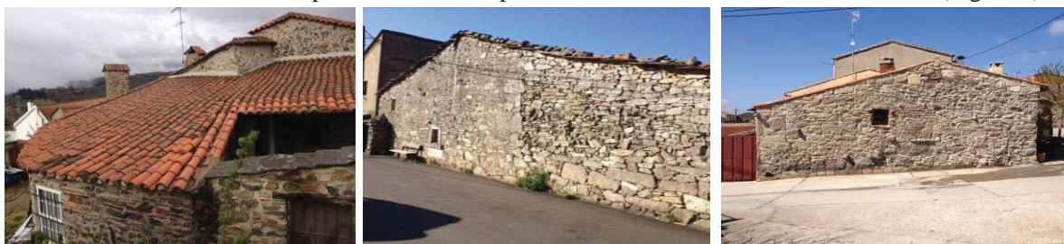
Figura 5 – Cobertura Captadora

O telhado de duas águas constituído pela composição de dois planos inclinados era o mais simples e o mais utilizado, sendo a maior vertente orientada a sul e a menor a norte. A maior área da vertente a sul permitia maximizar os ganhos solares. A área da envolvente exterior (incluindo as paredes), orientada a norte era reduzida para minimizar as perdas térmicas e atenuar o efeito do vento (Figura 5).