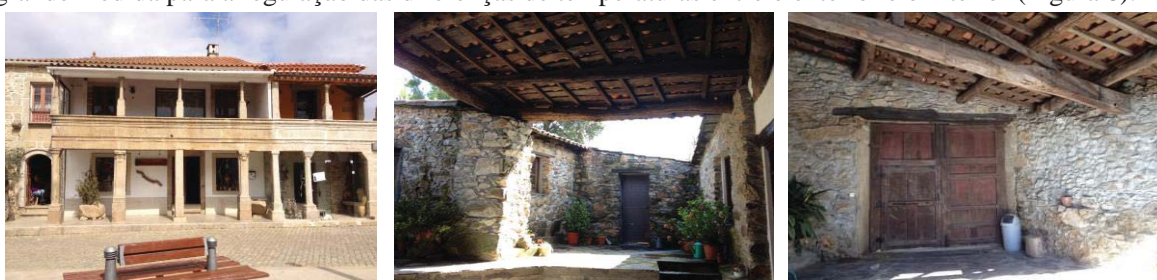
Figura 8 – Espaços de transição orientados.

Independentemente da principal função que exerça em cada edifício, todos estes espaços são elementos de integração com o meio ambiente e atenuadores das diferenças climáticas, contribuindo em grande medida para a regulação das diferenças de temperaturas entre o exterior e o interior (Figura 8).