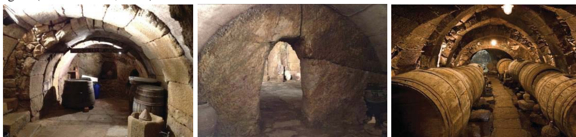
Figura 9 – Espaços subterrâneos convertidos em bodegas.

alvenaria de pedra ou de tijolo ou por arcos sucessivos, os quais permitem a estabilidade estrutural destes espaços. Os arcos são elementos construtivos em curva, geralmente em pedra, que emolduram a parte superior de uma abertura ou passagem e que suportam o peso proveniente do solo (Figura 9). As tipologias encontradas são diversificadas, tendo-se verificado existirem arcos abatidos, romanos e em ogiva (Ferreira et.al. , 2014).