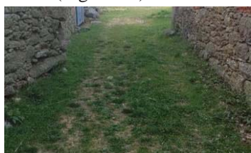
Figura 11 – Pavimentos respiráveis.

originará descida da temperatura do pátio criando uma zona de altas pressões que provoca a sucção do ar situado a um nível superior. Com a abertura de janelas ou portas para o pátio, o ar entrará pelo edifício podendo recorrer-se a uma ventilação cruzada através da abertura de vãos e janelas em paredes opostas. No inverno, a temperatura do pátio determinada pela proteção da vegetação é superior à temperatura do ar exterior (Figura 12).