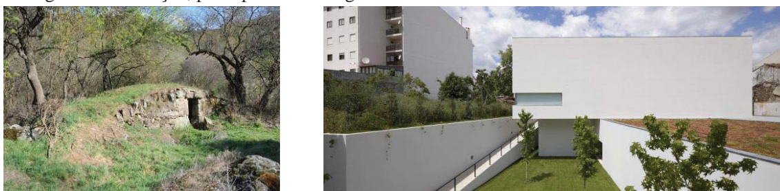
Figura 10 – Coberturas Verdes.

As coberturas verdes constituem soluções de aproveitamento dos telhados através da plantação de espécies vegetais. Devido às suas excelentes características bioclimáticas, as Coberturas Verdes constituem uma solução amplamente adotada pela arquitetura contemporânea, nomeadamente em países como os Estados Unidos da América, Alemanha, Áustria e Reino Unido. Em Portugal, a instalação de Coberturas Verdes ainda não se generalizou da mesma forma. Surgem como uma ótima solução arquitetónica para minimizar os aspetos negativos acima apontados, retribuindo de certa forma à natureza aquilo que lhe é retirado quando se ocupam os terrenos com a implantação de construções. Para além das questões estéticas, as Coberturas Verdes, compostas por substrato e vegetação surgem associadas sobretudo às questões ambientais e energéticas. A terra e a água retida pela vegetação têm uma influência significativa na melhoria do isolamento térmico e atenuação das oscilações térmicas, enquanto a vegetação influi positivamente na melhoria do microclima, contribuindo para na atenuação da ilha de calor. O ar contido na vegetação contribui ainda como isolamento térmico, para além de constituir uma proteção à superfície de substrato. A atenuação do efeito das chuvas torrenciais é outra vantagem desta solução, principalmente em grandes centros urbanos.