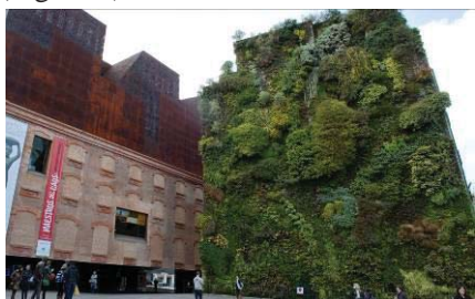
Figura 6 – Parede Verde.

Algumas das paredes tradicionais incorporam um sistema de suporte (mísulas), existente na própria alvenaria, que serve de guia ao crescimento das plantas acima da cornija dos telhados, tornando bem evidente a função que a vegetação assume como elemento integrador da envolvente do edifício. Em qualquer caso, as espécies vegetais crescem a partir do solo e vão apoderando-se das paredes que lhes servem de apoio, podendo por vezes ser munidas de estruturas de suporte distanciadas da habitação (Figura 7).