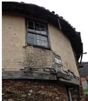
Figura 2 – Parede de Inércia em xisto e em adobe.