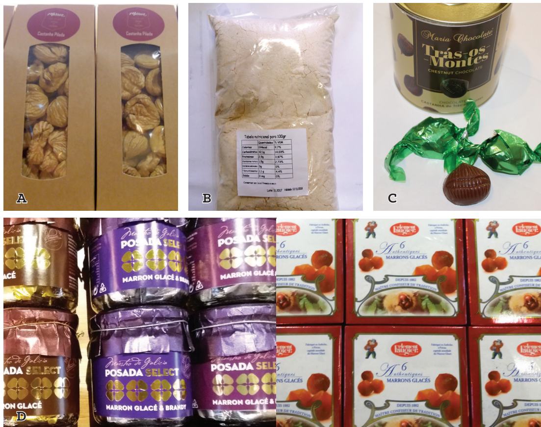
Figura 13.2 – Castaña pelada (A), harina de castaña (B), bombones de castaña (C), y Marron Glacé (D). [Fotos de las autoras] Castanha pilada (A), farinha de castanha (B), bombons de castanha (C), e Marron Glacé (D). [Fotos das autoras]

Algumas empresas transformadoras de castaña ya aplican el secado con aire caliente para obtener castaña pelada y posteriormente harina de castaña (Figura 13.2 A, B). En ge-