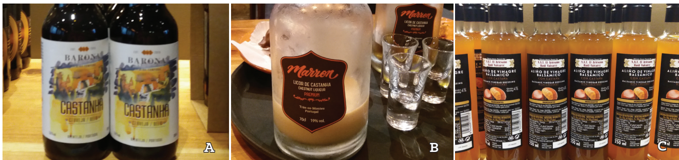
Figura 13.3 – Cerveja (A), licor (B) e vinagre (C) de castanha.

En otros países se pueden encontrar productos como: castaña ahumada (“ Castagne del prete ”, producto típico de la región de Campania, Italia) ( https://Amalfinotizie.it/Cas