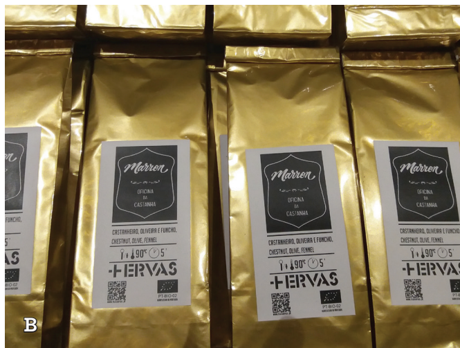
Figura 13.4 – Flor de castanheiro (A) e mistura para preparar infusões (B). Flor de castaño (A) y mezcla para preparar infusiones (B).