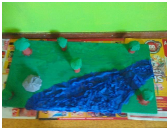
Figura 4-Maqueta da Amazônia

Na figura 4 observamos a maqueta realizada durante a atividade e os diferentes materiais que utilizamos.