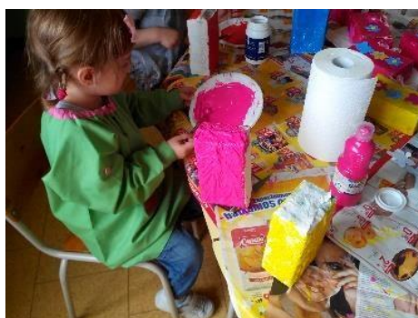
Figura 10-Realização da prenda do dia da mãe

Passamos para a pintura dos pacotes de leite, em que cada criança utilizou a cor preferida da sua mãe, como podemos observar na figura 10.