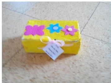
Figura 11-Frenda final do dia da mãe

Partindo do material que as crianças fizeram na sala, cada criança começou a decorar a caixa a seu gosto. Foi colocada rafia para que se pudesse fechar o guarda-joias, como podemos observar na figura 11