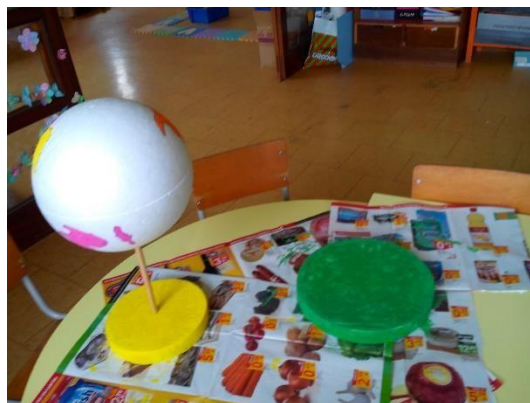
Figura 3-Globo feito com esferovite

No dia seguinte de forma a abordarmos o país escolhido pelas crianças procedemos à leitura da história “ Meninos de todas as cores ” de Maria Ducla Soares que trata o povo indígena, a variedade de raças e etnias existentes, pois não importa a cor, raça ou etnia, porque é bom ser diferente.