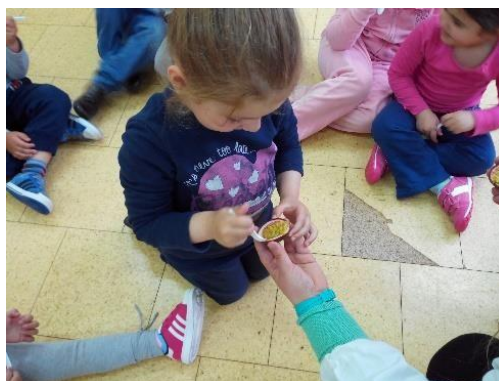
Figura 5-Degustação de frutas tropicais

Então como prometido levamos alguns frutos tropicais para a sala, tais como: ananás, manga, papaia, mamão, maracujá e goiaba. Demos então início à atividade que consistia em degustar as várias frutas. Cada criança provava um pouco de cada fruta. É de salientar que duas crianças não quiseram experimentar as frutas, por isso não lhes foi possível realizar a atividade. Em seguida, realizamos um jogo, a uma criança de cada vez colocamos uma venda nos olhos e demos um pedaço de uma fruta, e a criança teria de adivinhar qual era a fruta, como podemos observar na figura 5.