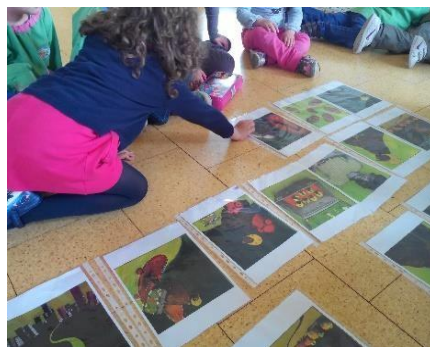
Figura 6-Reconto da história

Pela observação destas figuras percebemos que as crianças estiveram atentas durante a leitura da história pois conseguiram fazer o reconto da mesma através de imagens.