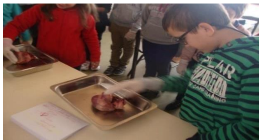
Figura 13- Exploração de um suíno

De forma a iniciar a atividade, as crianças calçaram luvas e conversamos sobre quais os cuidados que deviam ter no momento da manipulação do coração. Ao longo da exploração externa e interna do coração, as crianças identificaram a localização do coração no nosso corpo, em quantas partes estava dividido, a coroa de gordura e a espessura das veias e das artérias.