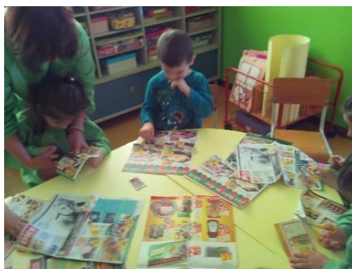
Figura 12-Recorte de imagens

Dividimos as crianças em três grupos e cada grupo ficou responsável pela construção de cada um dos ecopontos (amarelo, verde e azul). Cada grupo pintou então a sua caixa, de acordo com a cor previamente decidida. Enquanto a tinta secava decidimos que, para decorar os nossos ecopontos, iríamos colocar imagens de embalagens, garrafas e papel nos respetivos ecopontos. Então procedemos à exploração de revistas de forma a encontrarmos as imagens que necessitávamos para posteriormente recortar e colar nos respetivos ecopontos, como podemos observar na figura 12.