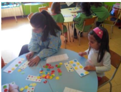
Figura 7-Jogo de sequências

No dia seguinte iniciamos a elaboração do guarda-joias, forramos o pacote com guardanapos de papel e cola branca e deixamos secar, para mais tarde podermos pintar. Enquanto aguardávamos que o trabalho secasse algumas crianças sugeriram que fizéssemos alguns jogos. Então fomos à área dos jogos para em conjunto selecionarmos alguns. Após uma breve observação aos jogos existentes decidimos utilizar os blocos lógicos, tangram e jogos de sequências. Dividimo-nos em três grupos e após a explicação das regras iniciamos os jogos, como podemos observar nas figuras nº 7,8 e 9.