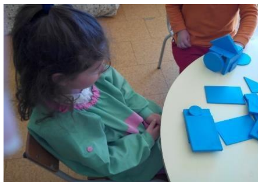
Figura 8-Blocos lógicos