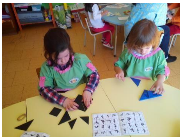
Figura 9-Jogo do tangram