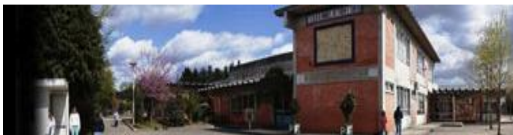
Ima. 2 E.B. 2,3 D. Manuel de Faria e Sousa (Felgueiras)

Ao nível de comportamento e aproveitamento, a escola considerava a turma bastante homogénea a nível académico. No entanto é preciso salientar a existência um aluno com acompanhamento de quase permanente com NEE (Necessidades Educativas Especiais) que sofria de perturbações do espectro do autismo. O aluno não foi alvo de qualquer tipo de adaptação curricular, no contexto da Educação Musical, por conseguir durante todo o período em que decorreu a PES acompanhar, satisfatoriamente, o decurso das atividades letivas, mantendo apenas o acompanhamento regular do professor do Ensino Especial, nas outras áreas curriculares. Neste sentido tornou-se claro e pertinente, todo o cuidado na elaboração de uma estratégia educativa global para a turma, tendo em conta critérios, conteúdos e metodologias a adotar na concretização da PES, direcionando-a para uma maior e efetiva articulação e harmonia entre todos