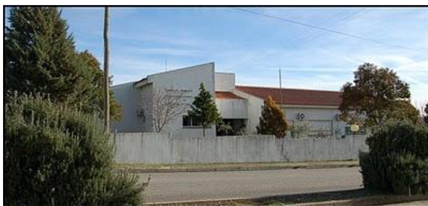
Ima. 1 Escola Básica de Vila Nova de Foz Côa

O desenvolvimento cognitivo dos alunos era heterogéneo, já que cada criança tinha o seu ritmo de trabalho e aprendizagem fazendo com que se encontrassem em patamares diferentes. Esta turma necessitou de um reforço de regras básicas de comportamento na sala de aula, de forma a promover uma maior concentração e melhoria do ritmo de aprendizagem bem como uma maior harmonia em sede de sala de aula.