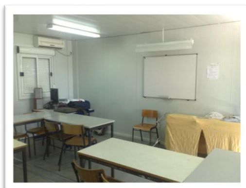
Img.4 Sala de aula da Escola E.B. 2, 3 D. Manuel de Faria e Sousa (Felgueiras)

Neste sentido, acho pertinente realizar uma caracterização que confira maior precisão à realidade por mim encontrada, em termos de equipamentos e espaços disponíveis.