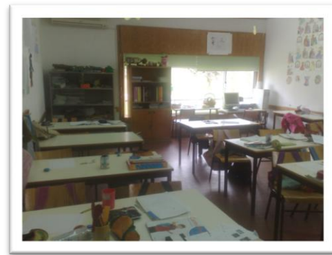
Img.5 Sala de aula da Escola Básica de Vila Nova de Foz Côa

Como já referi anteriormente, ao nível do 2º e 3º Ciclos a questão dos espaços e materiais é bem mais favorável, na medida em que dispunham de equipamentos para a realização da Educação Musical bastante adequados e em bom estado de conservação. Estas circunstâncias permitiram que tivesse beneficiado de condições bastante aceitáveis para o desenvolvimento da PES, no âmbito destes ciclos, sobretudo no que concerne às atividades ligadas ao manuseamento de instrumental Orff.