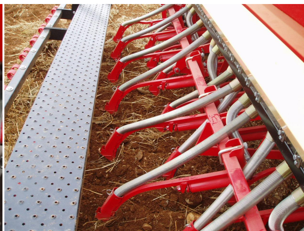
Fig. 4 – Tubos condutores e órgãos de enterramento