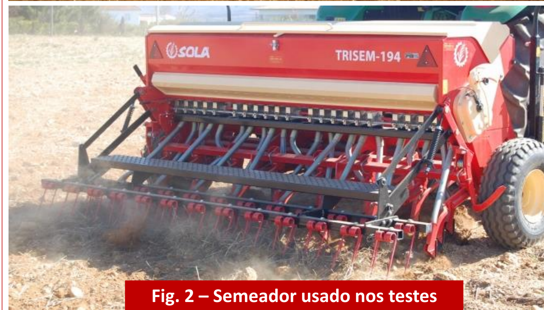
Fig. 2 – Semeador usado nos testes