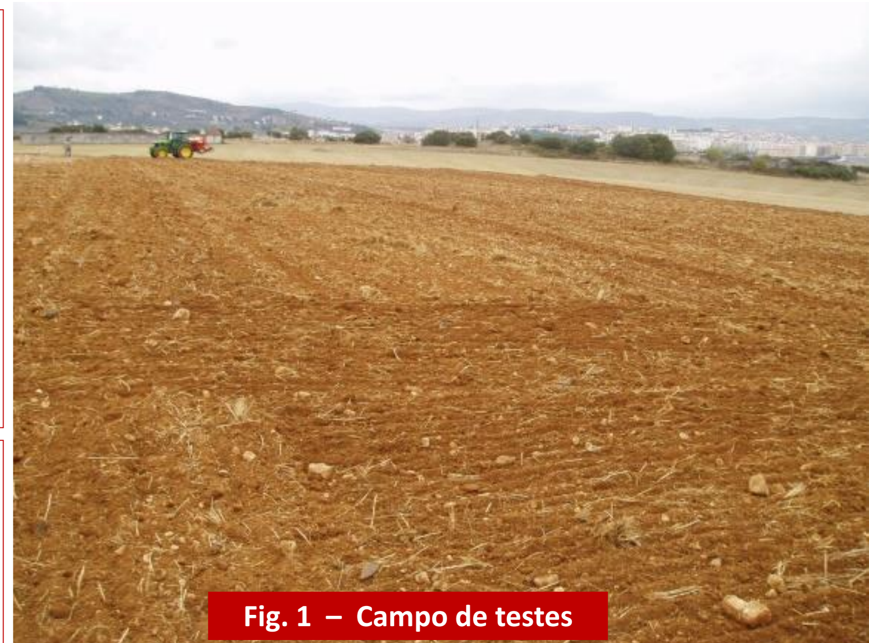
Fig. 1 – Campo de testes