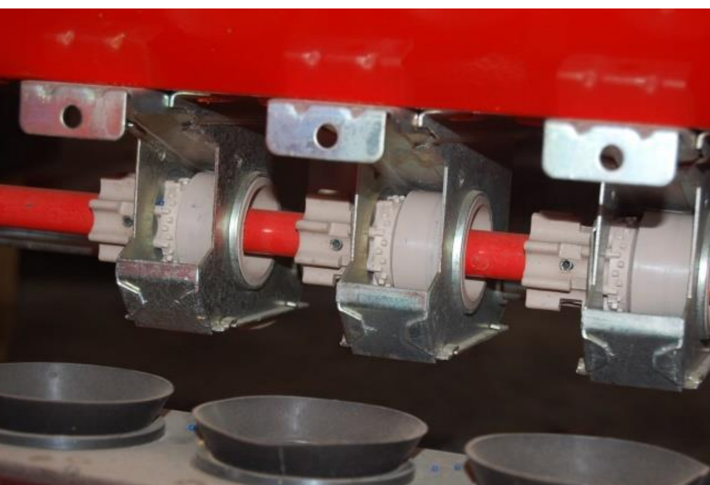
Fig. 3 – Órgãos de distribuição do semeador