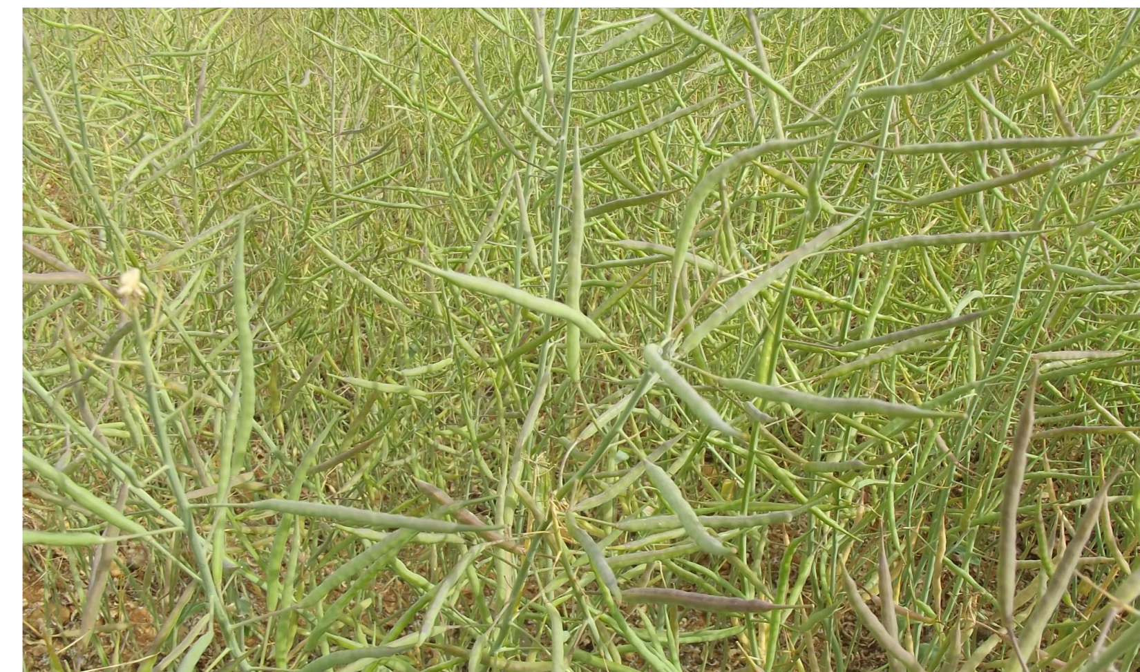
Fig. 5 – Aspeto da colza 8 meses após a sementeira