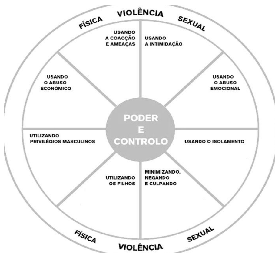
Figura 2 Roda de poder e controle Duluth

Para uma maior compreensão das relações de poder, associadas à violência doméstica, é pertinente conhecer um modelo que desenvolve estratégias de intervenção para o combate dessa violência, conhecido com a “roda do poder e controle”, como se pode ver na figura seguinte.