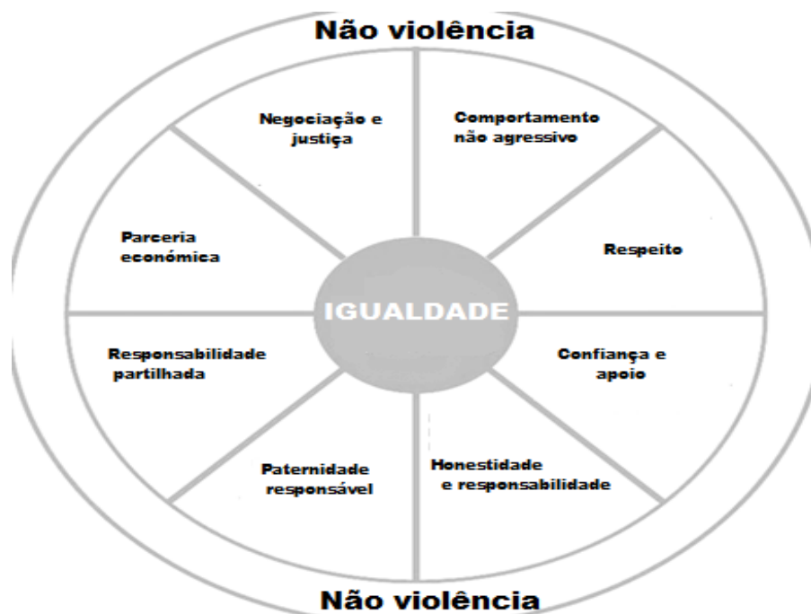
Figura 4- Roda de igualdade Duluth

Baseando no trabalho socioeducativo do educador social, é pertinente referir a “roda da igualdade” do modelo Duluth, pois enquadra-se no trabalho que o educador social pode realizar perante a problemática da relações de poder e controlo, enquadradas na violência nas relações de intimidade, a nível de informação, orientação, intervenção, desenvolvimento e promoção de mudanças.