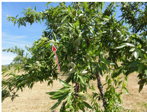
Figura 25 – Colheita de amostras de folhas