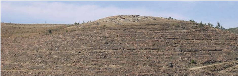
fig. 2 Encosta Sul de Castelo Velho