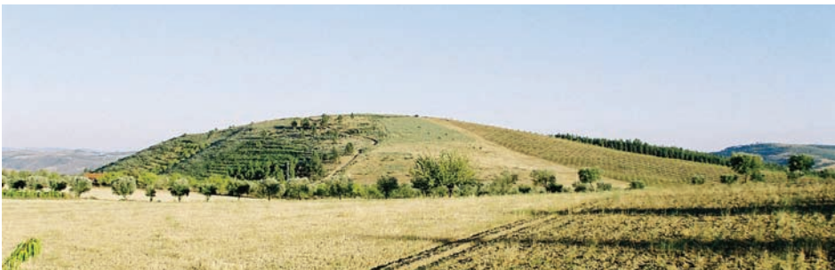
fig. 3 Castanheiro do Vento

ANDREWS, M. (1999) - Landscape and Western Art (Oxford History of Art) . Oxford: Oxford University Press.