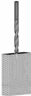
Fig. 3 Malha de elementos finitos.

O presente trabalho propõe a construção de um modelo dinâmico tridimensional que pretende simular o processo de furação óssea envolvendo todos os parâmetros considerados importantes. Este modelo foi desenvolvido através do módulo LS-Dyna do programa Ansys e apresenta uma malha de elementos finitos representativa de uma furação, incluindo o material do osso e o material da broca, Fig. 3.