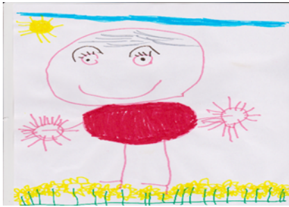
Figura 1 Representação de uma pessoa idosa (CF4)