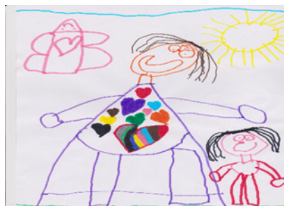
Figura 5 Representação positiva do envelhecimento e velhice (CF5)

Também, através do desenho realizado pelo CF5 podemos verificar a cumplicidade existente entre as crianças e a sua avó. A figura ilustra uma criança com a sua avó cheia de corações de diversas cores, apresentando-se esta uma imagem colorida, alegre e positiva acerca das interações que mantêm.