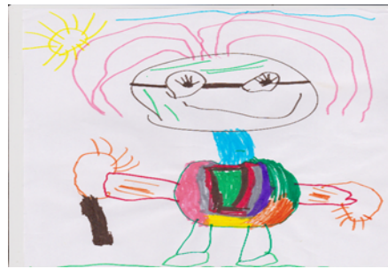
Figura 11 Idosa de bengala (CM9)