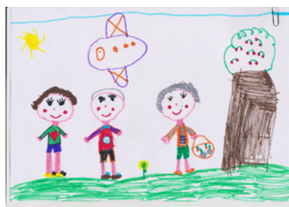
Figura 7 Representação positiva do envelhecimento e velhice (CF13)

Já no desenho do CF13 observa-se a criança a apanhar cerejas com os seus dois avós, evidenciando, novamente, a partilha de momentos prazerosos e de realização de tarefas em conjunto.