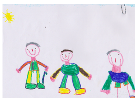
Figura 4 Conceito de velhice baseado nos avós (CM18)

No desenho do CF17 podemos verificar que existe um idoso e uma criança a apanhar cerejas num ambiente de proximidade, harmonia e felicidade. Já no desenho do CM18 podemos observar dois idosos a passear com uma criança mais nova, demonstrando assim, um clima de proximidade, companheirismo e felicidade entre os idosos e a criança mais jovem, para a realização dos desenhos as crianças inspiraram-se nas suas vivências de proximidade.