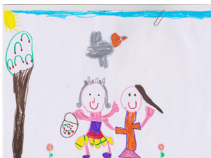
Figura 3 Conceito de velhice baseado nos avós (CF17)

Verificou-se que as crianças, na maioria das vezes, quando pensam no conceito de velhice, pensam nos seus avós, uma vez que, eles são para si a imagem mais próxima que têm de uma pessoa idosa, tal como pode ser verificado através dos desenhos do CF17 e CM18.