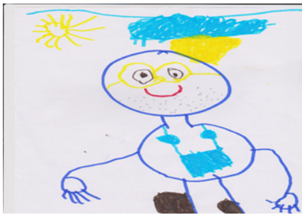
Figura 10 Idoso de óculos (CM2)