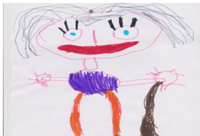
Figura 9 Idosa de bengala (CF12)