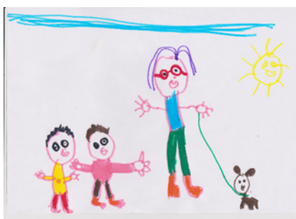
Figura 6 Representação positiva do envelhecimento e velhice (CF10)

No que se refere aos desenhos, podemos verificar que alguns participantes se ilustraram a realizar atividades com os seus avós. No desenho da CF10, podemos visualizar uma avó a passear com o seu cão e os seus dois netos pequenos, o que faz evidenciar a convivência entre avós e netos no quotidiano.