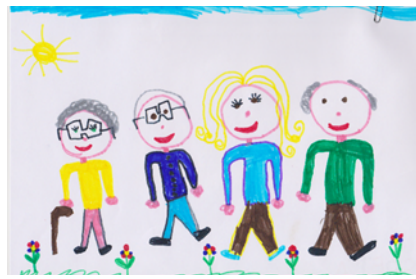
Figura 8 Idosos de bengala e óculos (CF15)

Esta evidência aparece também no estudo de Dias e Miguel (2012), em que as crianças quando desenhavam uma pessoa idosa utilizavam os seguintes utensílios/acessórios: óculos, bengalas e andarilhos.