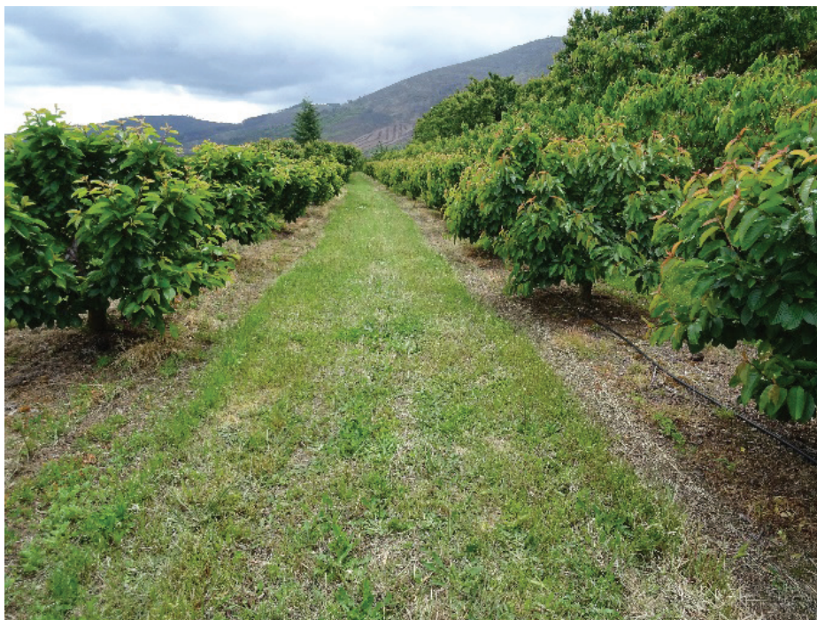
Figura 6.1 – Sistema de gestão do solo mais generalizado em fruticultura: herbicida na linha e vegetação controlada com corte na entrelinha.

Movilizar el suelo significa exponerlo a la erosión. La erosión hídrica puede originar pérdidas de suelo muy elevadas, reduciendo progresivamente su espesura y su fertilidad natural, incluyendo la capacidad de almacenar agua. Las movilizações aumentan la difusión de oxígeno en el suelo favoreciendo la actividad de los microorganismos hetero-