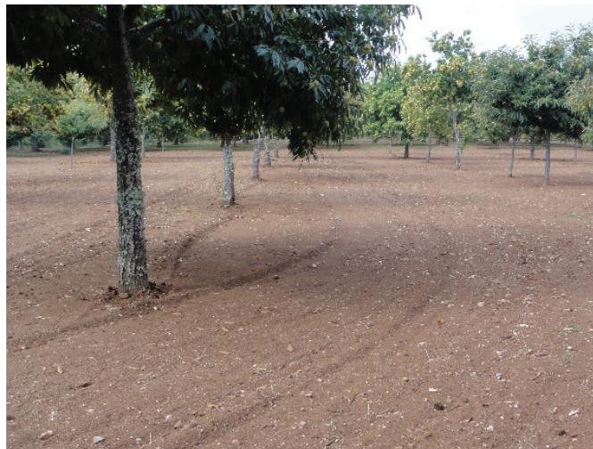
Figura 6.3 – Souts de castanheiros em que o solo é gerido com mobilização convencional. Plantaciones de castaños en que el suelo es gestionado con laboreo convencional.