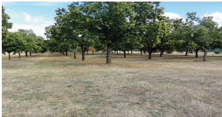
Figura 6.4 – Soutos geridos com cobertos de vegetação natural. Plantaciones gestionadas con cubierta vegetal natural.