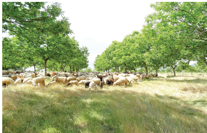
Figura 6.6 – O pastoreio com ovinos podería ser un método importante na gestión de cobertos em castanheiro se produtores de castanha e pastores tivessem consciéncia das múltiples vantagens. El pastoreo con ovejas puede ser un método importante de la gestión de las cubiertas en castaño si los productores y los pastores tuviesen consciencia de las múltiples ventajas.