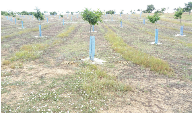
Figura 6.5 – Gestão do solo com herbicida pós-emergência em castanheiro. Gestión del suelo con herbicida de post-emergencia en castaño.