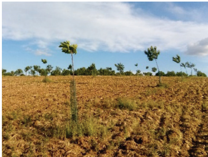
Figura 6.2 – Substituição de árvores centenárias mortas por plantas jovens e instalação de souts em antigas terras de cereal são as formas encontradas de manter a produção de castanha.

Sustitución de árboles centenarios muertos por nuevas plantas e instalación de plantaciones en tierras que tradicionalmente se dedicaban al cereal son las formas con las que se mantiene la producción de castaña.