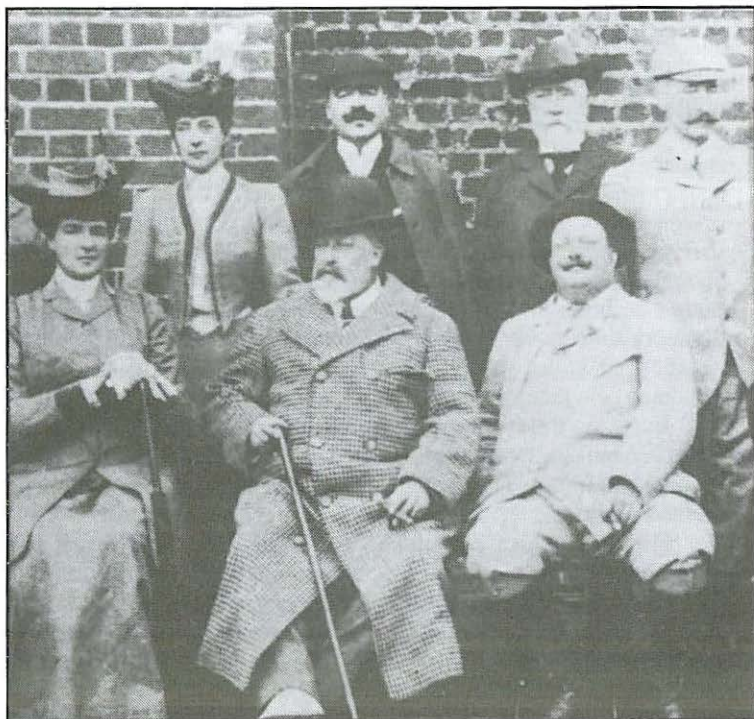
D. Carlos I e Eduardo VII