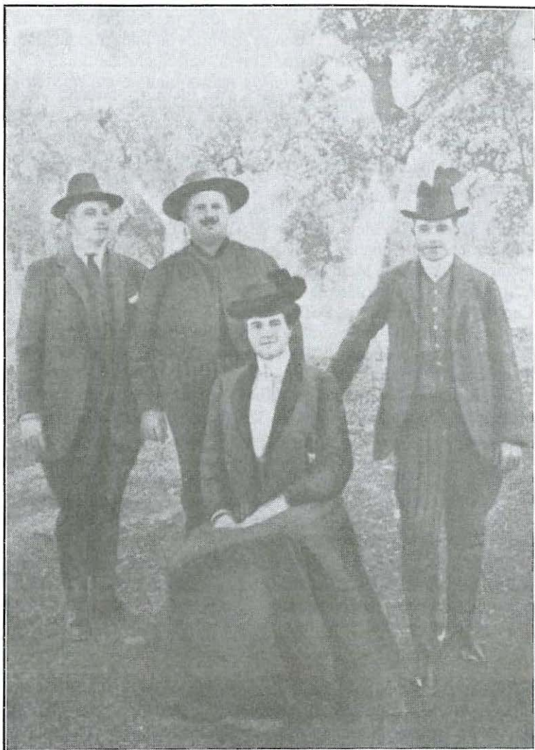
D. Carlos I, a Rainha D. Amélia e Filhos, D. Luis e D. Manuel em trajos de caçador alentejano.